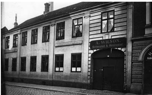
Da virksomheden lå Klostergade 14 i Århus. Foto 1906.

Jeg blev vel modtaget i Aalborg, og da jeg havde andre slægtninge der, også en søster til min fader, som bad mig komme til sit hjem, når jeg havde lyst og fik fri, fattede jeg mod. Jeg fik på loftet et lille værelse, hvor jeg i en seng skulle sove sammen med en svend, og