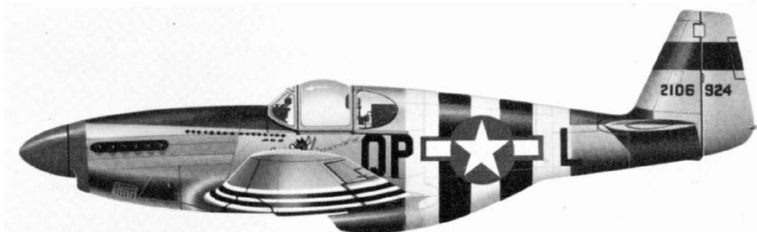
Mustang-jager af den type, der angreb toget mellem Tim og Hee.

»I august 1944 havde min kone og jeg købt et 14 dages kort til DSB for i vores ferie at besøge familie og venner i Odense, Kalundborg, København og Aarhus. Søndag den 27. august