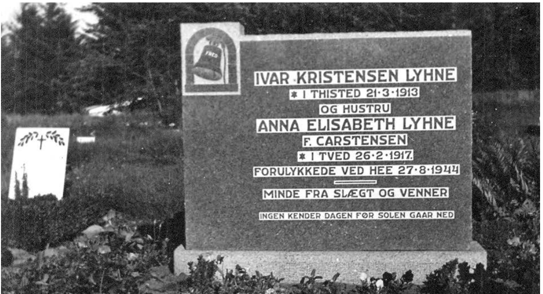
Gravstedet på kirkegården i Tved er bevaret endnu.