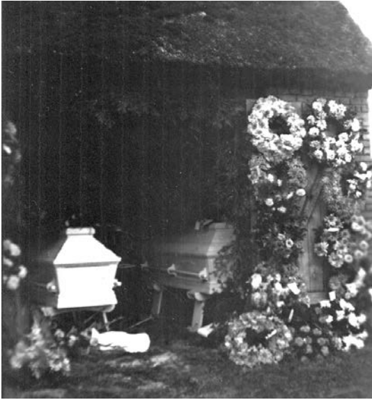
De to kister i vognporten i Tved.

Dagen efter ulykken skrev Thisted Amts Tidende: »To dygtige og tiltalende unge mennesker fandt døden, og et lille barn mistede begge sine forældre.«