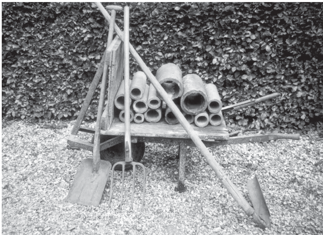
Tegldrænrør af forskellige størrelser samt nogle af de redskaber, der blev brugt til dræning – bemærk især træskovlen til højre, der med sit runde blad kunne lave en rille til at lægge rørene i.