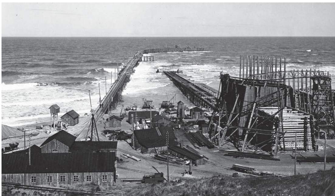
Havnebyggeriet i Hanstholm i 1930'erne. I 1925 blev havnevisionerne på vestkysten omdrejningspunktet i en roman om konflikten mellem natur og kultur, mellem privateje og ekspropriation: Fugle omkring Fyret.