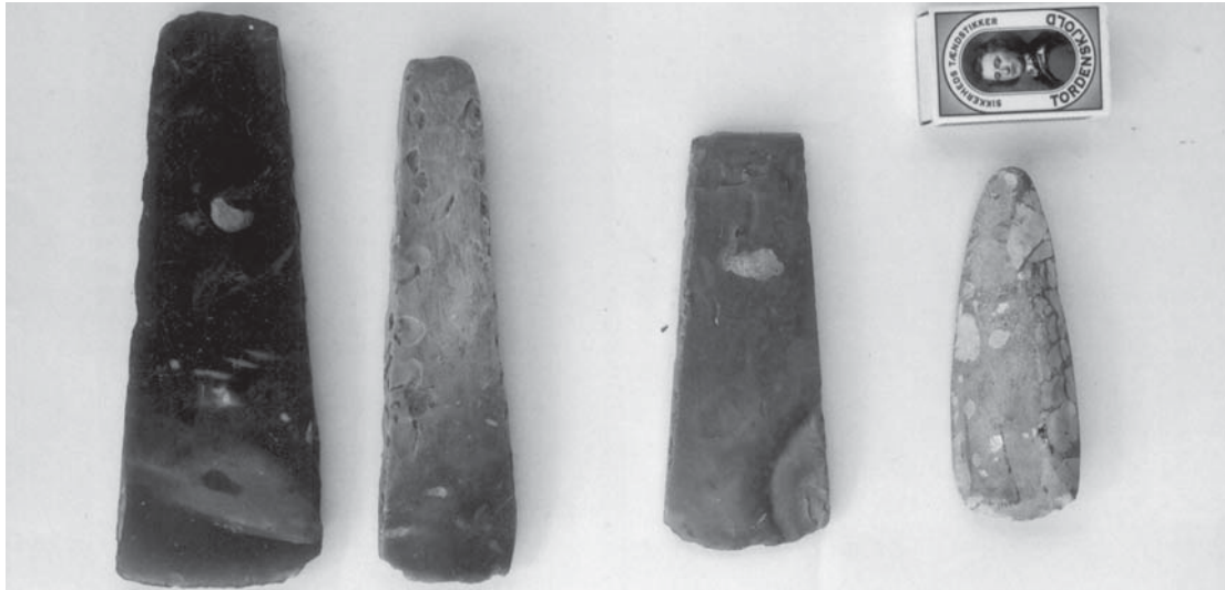
Til venstre ses de to første økser, der blev fundet ved drænarbejde. Det tredje dukkede op ved gruskørsel, og øksen længst til højre blev fundet, da der blev ledt efter oldsager.

en lille utrolig fin, tyndbladet økse i hånden. Det rene kunsthåndværk! Det er en mærkelig fornemmelse at have noget så pænt i hænderne midt i halvmørke, sjask og søle.