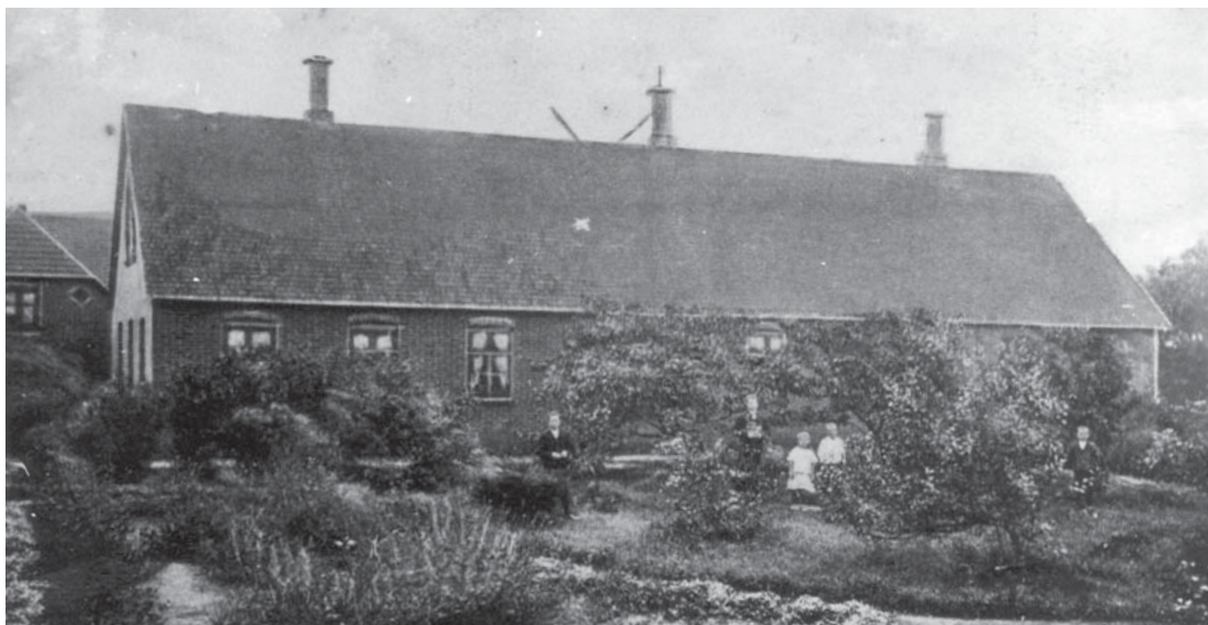
Ny Hornstrup, 1905.

Et andet af de store gøremål, som man dengang selv skulle klare hjemme, var bagning. Før min tid var det almindeligt, at al bagning foregik hjemme. Men jeg kan ikke huske, at man bagte rugbrød i vort hjem. Vi fik rugbrødet hos ba-