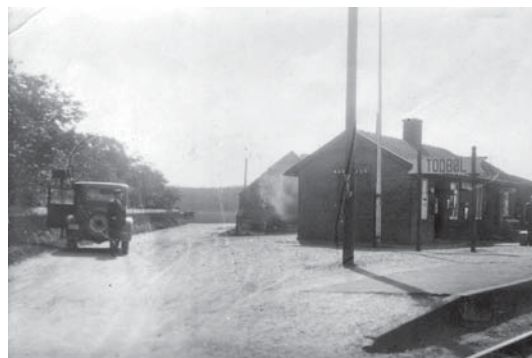
Todbøl Station, 1930.

Allerede i 1930'erne går det tilbage med stationen. Bilerne bliver mere udbredt, og især