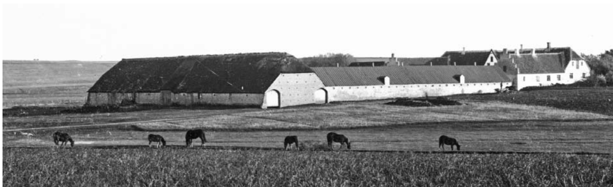
Desværre findes der ingen tegninger af Momtoft fra den tid, artiklen omhandler, men midt i 1900-tallet tog gården sig sådan ud set fra nordvest.