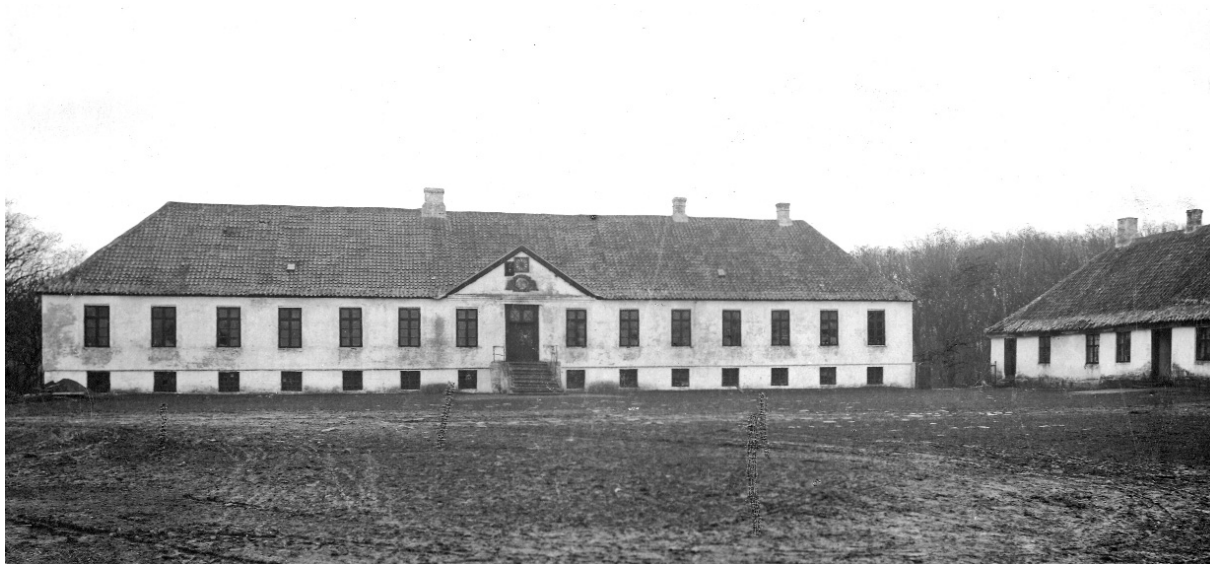
Billede af Kjolbygaard set fra gårdspladsen. Sandstensrelieffet ses over hoveddøren.