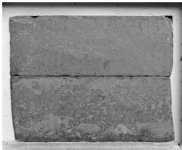
Detaljebillede af sandstenstavlerne med latinsk indskrift (nu ulæselige) i museets gård.

Efter 116 års ejerskab var den Berregaardske tid forbi på Kjølbygaard. Derefter fulgte en meget omskiftelig periode for herregården, der skiftede ejer ikke mindre end 7 gange i 1800 tallet, og i 1915 blev den gamle herregård med et tilliggende på 305 tdr. land solgt for 210.000 kr. til Thylands Udstykningsforening. Denne videresolgte avlsbygningerne og jordtilliggendet, hvorpå der op-