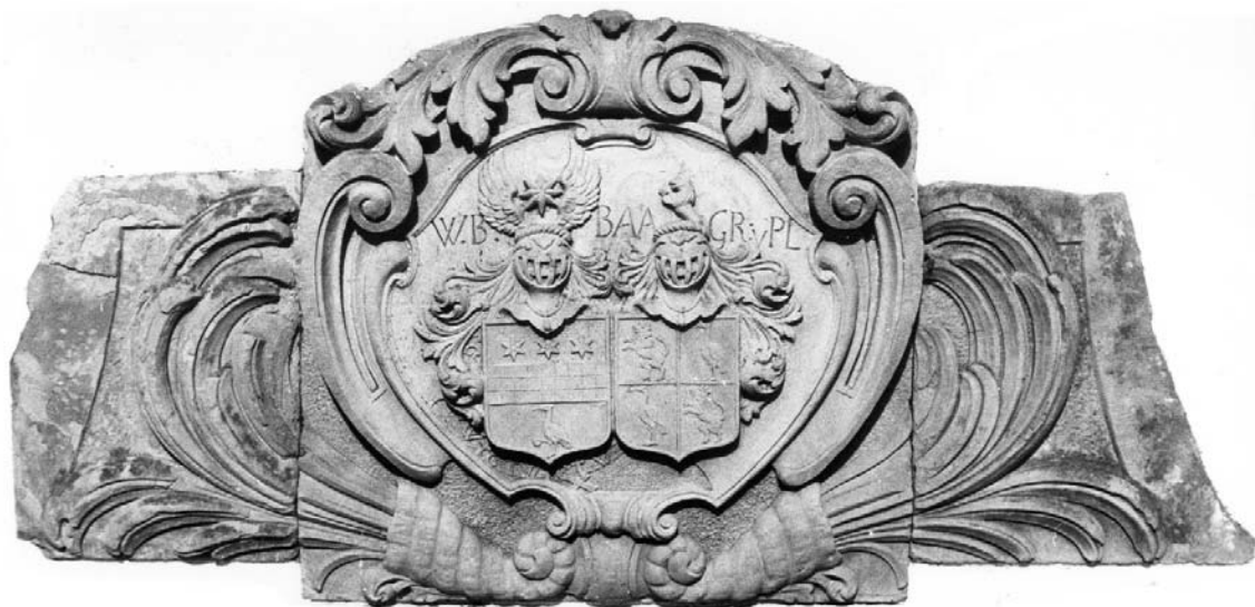
Sandstensrelieffet med de to våbenskjolde i museets gård.

i museets gård. Da han i 1766 lod opføre en ny 70 alen lang (ca. 44 m) hovedbygning på Kjolbygaard, skulle ingen lades i tvivl om ejerforholdet til herregården. Derfor fik han lavet et relief i sandsten, som skulle opsættes og pryde frontonen over hoveddøren ud mod gårdspladsen.