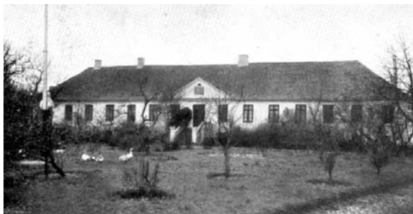
Billede af Kjolbygaard set fra haven. Sandstentavlerne ses over havedøren.