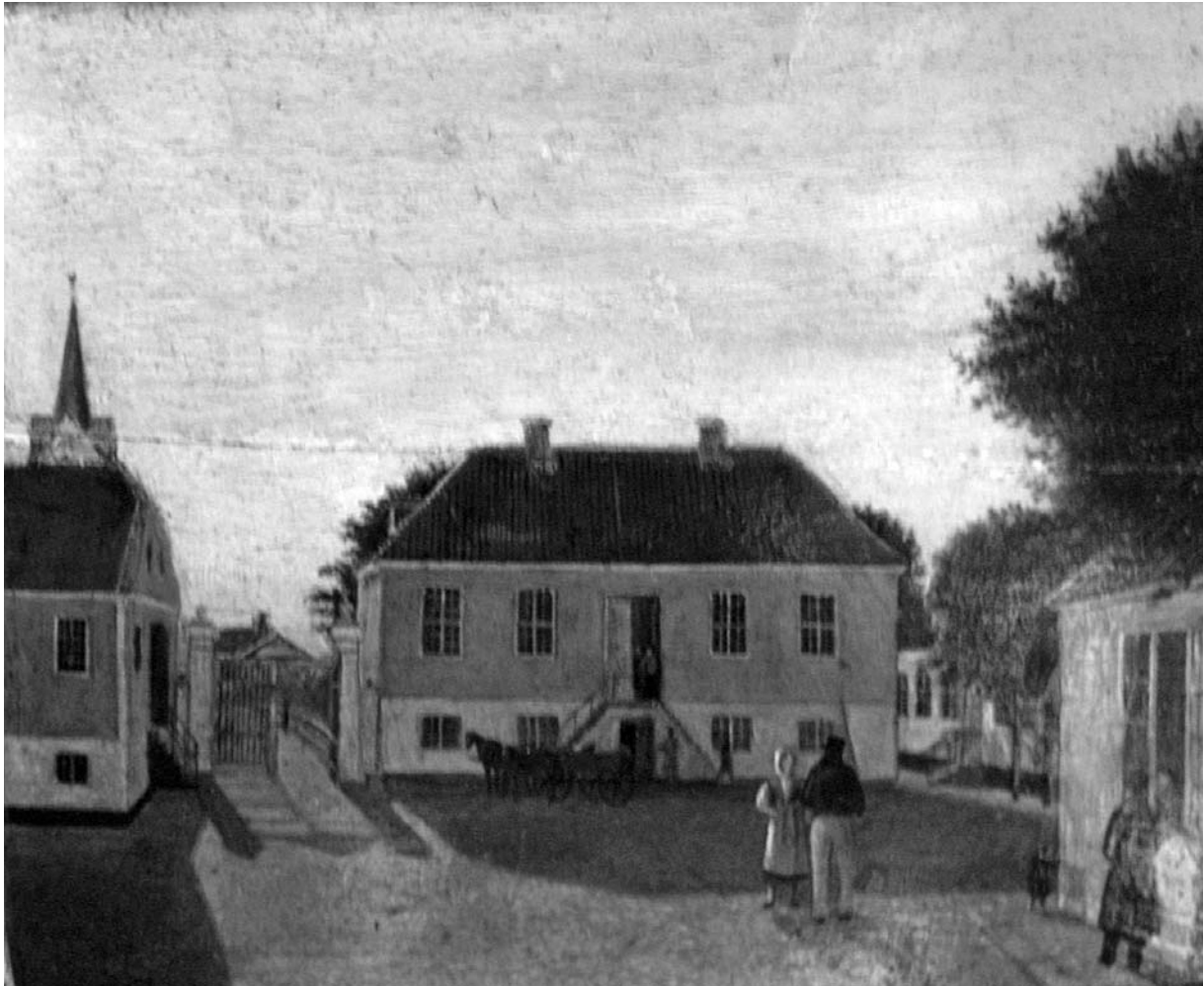
Det gamle rådhus på Store Torv, hvor retssagen foregik. Rådhuset blev bygget i 1803. Maleri Thisted Museum.

indløste hos Farveren noget Tøj, hvorfor han betalte 4 Rd, til hende købte en Hue og derfor betalte 2 Rd, alt foranstaaende var hende skiænket og givet, uden at han enten havde ventet Godtgjørelse eller nogen Tieneste, men dog havde han forventet, at hun desvilligere ville have været hos ham og noget længere bestyret Huusholdningen«.