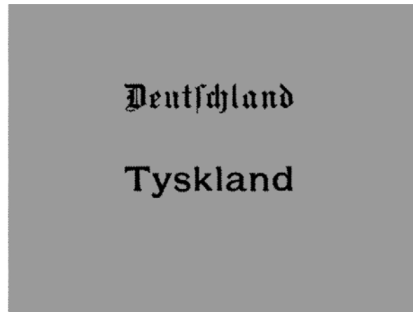
De to stemmesedler som de stemmeberettigede kunne vælge mellem ved afstemningen i 1. zone 10. februar 1920.

grundtvigske Maries reaktion: »...Derpå holdt han en omvendelsesprædiken så fed og flad, at man ikke kan forstå, nogen kunne opbygges ved sådan noget bavl... Om aftenen kl. 8 samledes vi i skolen, hvor to store skolestuer var sat i forbindelse med hinanden og smukt pyntede med flag, gran og agitationsbilleder. Her var dækket kaffeborde til 250 mindst, så megen plads var der ikke til hver. Og her, som overalt, var der genkendelse, latter og tale. Nogen særlig leder af dette samvær mærkede man ikke, men til kl. 2 sang vi, holdt taler og råbte hurra. Det var ikke just mange sange, der veksledes med, men hvad gjorde det? Så sang vi nogle to gange, andre tre gange. Kaffen var tynd, men der var nok af den, og kage og tærte var der rigeligt af. I det hele taget står denne aften for mig i stor glans. Der blev ikke talt i høje toner, men glæde og frigørelse var der.«