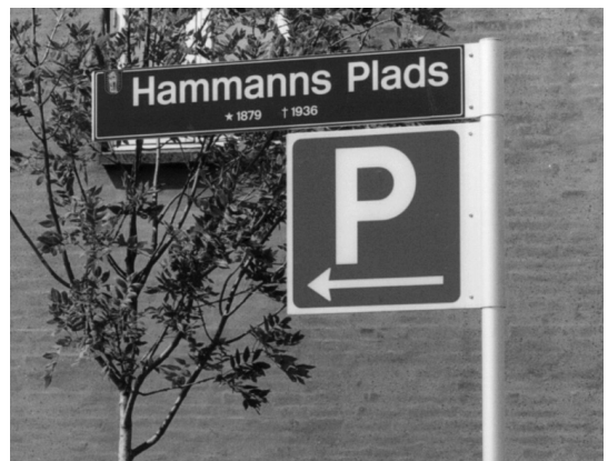
Skiltning til Hammanns Plads i Nørregade i Thisted.

Museumsassistent, Museet for Thy og Vester Hanherred.