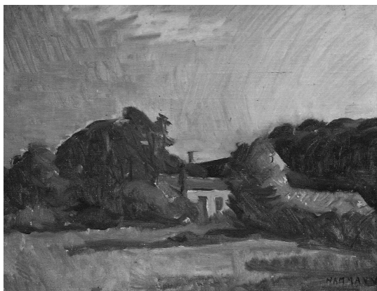
Engen bag Nørregade 27, Thisted. 45x52 cm. Olie på lærred.

strømninger i europæisk malerkunst, og hver på sin måde ladet sig inspirere i det videre kunstneriske forløb. Som tidligere nævnt fik farven og lyset stor betydning i Hammanns værker, og han har sikkert med stor interesse studeret netop impressionisterne i Paris.