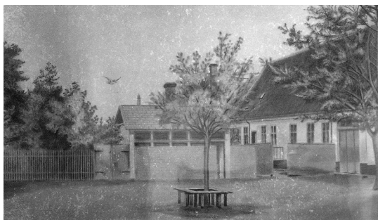
Realskolens Gård, ca. 1900. 31x50 cm. Kultegning.

Alle de ovennævnte malerier og tegninger befinder sig i dag i Museet for Thy og Vester