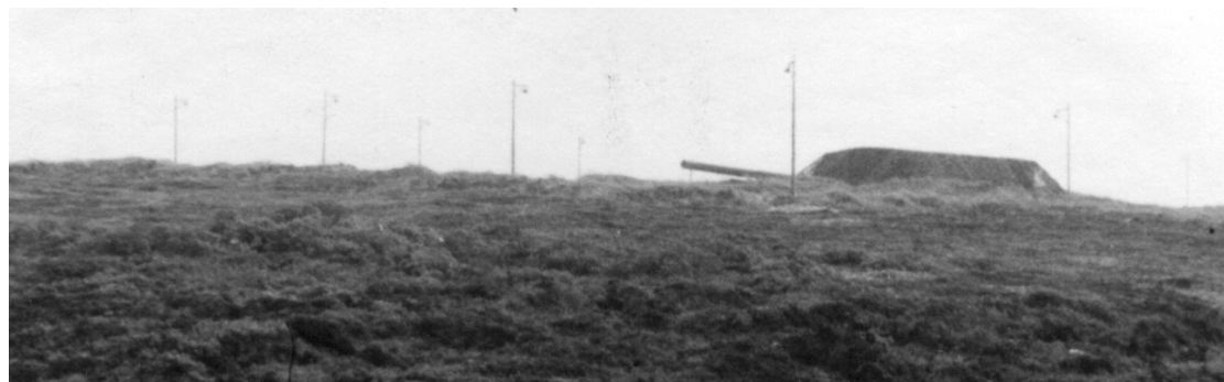
I det perfekte illusionsnummer skal der være et gran af sandhed, så gadelamperne var rigtige nok.

Skinanlæggene ved Febbersted er ikke omfattet af fredning. De ligger på marker, der