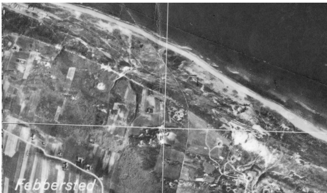
Anlægget i Febbersted blev fotograferet fra luften flere gange både under og efter krigen.

Originale konstruktionstegninger fra arkiverne viser, hvordan man anstrengte sig for at få byggeriet til at se helt rigtigt ud.