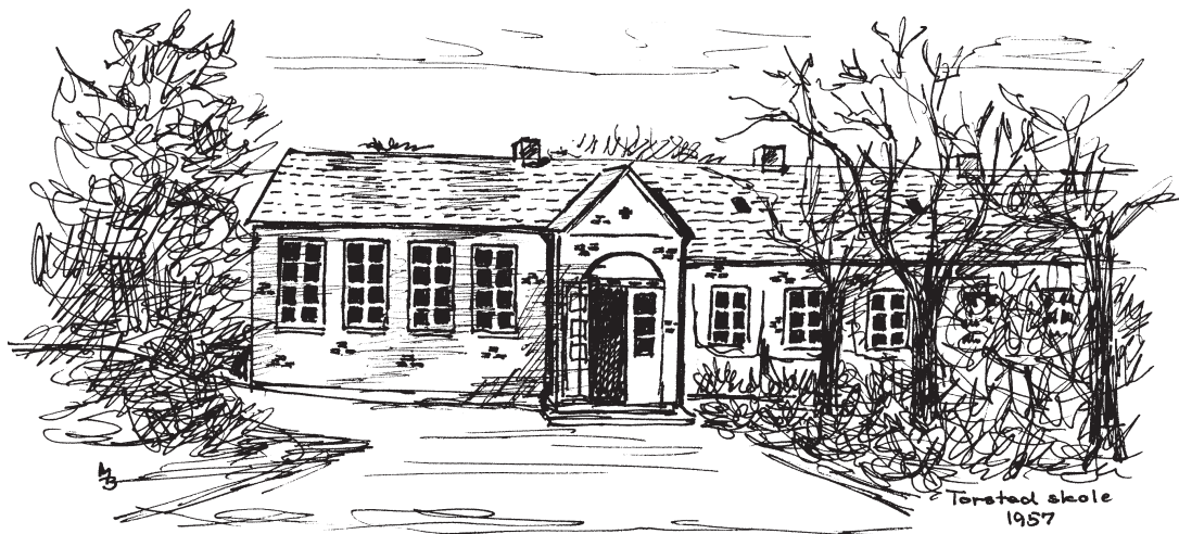
Torsted skole 1957.

Selve grunden var ret stor – og omfattede »Bakken« – en legeplads/fodboldbane – haven