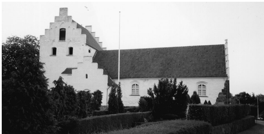
Ørbæk kirke, fotograferet i sommeren 2002.