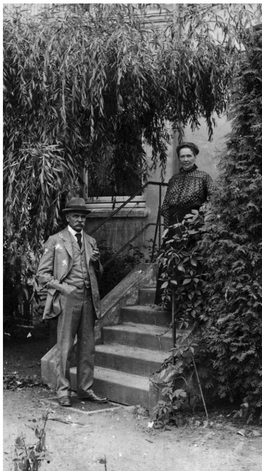
Ægteparret Jacobs ved køkkentrappen i haven.

Men hvad gør vi nu? – Kørehesten blev spændt for den lette fjedervogn, datidens »varevogn«, og så kørte far til Hurup Jernstøberi, de måtte da kunne svejse den! Men nej – den ville aldrig få den fine klang tilbage,