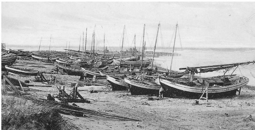
Fiskerbåde på stranden ved Vorupør, ca. 1910.

med afprøvningen bestod organisationsformen i Vorupør sin afgørende prøve. Fiskercompagniet havde det, som alle individuelle projekter manglede, nemlig driftskapital. Jens Munk Poulsen fortæller: