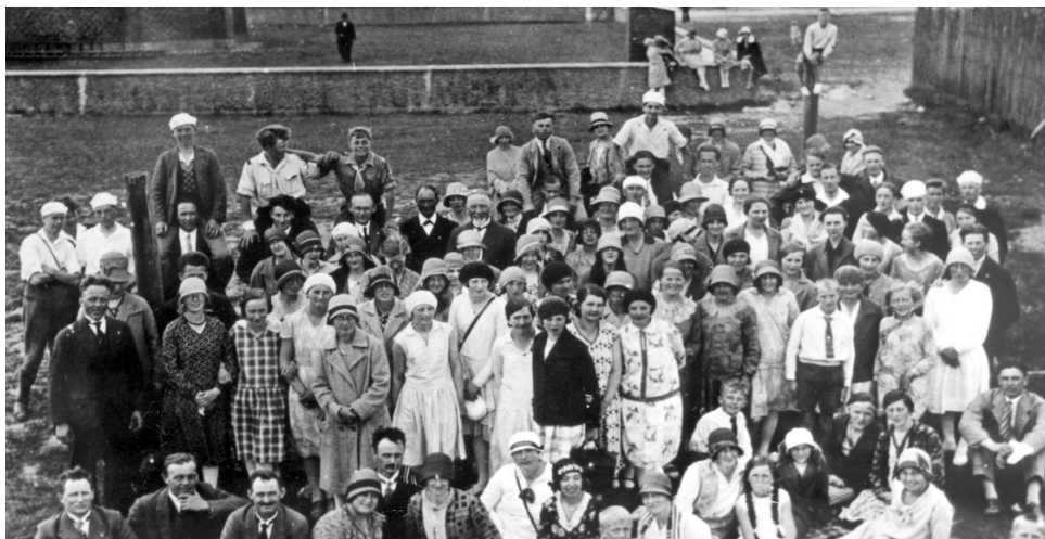
Samtalemøde ved kirken.