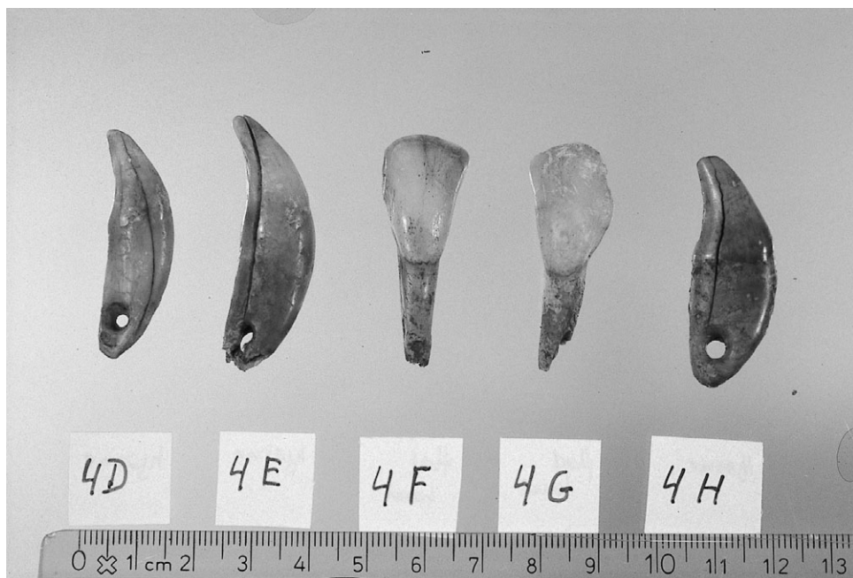
7: Tandperlerne i urnen.

gravningen i felten, at der med sikkerhed var to tandperler på overgangen mellem den løse jord og de brændte ben, der givetvis fyldte den nedre del af urnen. Ved at fjerne nogle af skårene til overdelen af urnen blev det muligt at bortgrave den løse jord, der på det seneste var faldet ned i urnen og som delvist dækkede den ene tandperle. Og der gik kun ganske kort tid, så dukkede endnu en tandperle op og straks efter endnu to mere. Der lå med andre ord fem tandperler placeret oven på de brændte ben (foto 6). Tre af tænderne var hjørnetænder, mens de sidste to var fortænder. Ved at kigge nærmere på tandperlernes placering blev det klart, at de lå sådan, at de i sin tid må have hængt sammen i en kæde, formodentlig en halskæde. Tandperlernes ende med hullerne lå nemlig ret tæt ved hinanden og ved at forestille sig