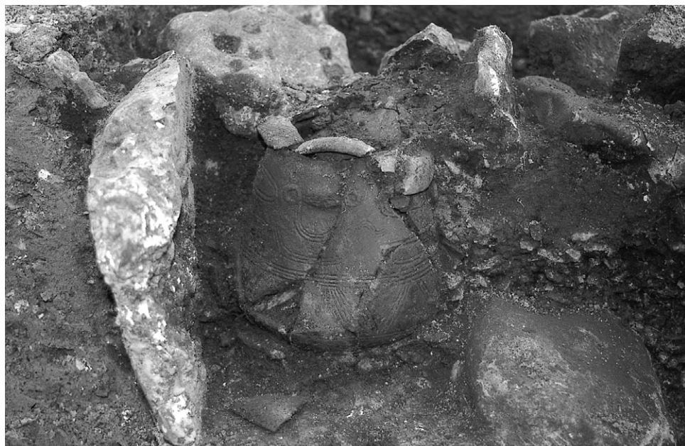
3: Frem dukker et smilende »ansigt«.

derefter en bred smilende »mund« bestående af tre opadvendte halvcirkler, og til sidst kunne jeg se, at der også var en »næse«. »Næsen« havde oprindeligt bestået af en hank, men da hanken allerede i bronzealderen var slået af (med vilje?), markeredes »næsen« nu kun af det sted, hvor den nedre ende af hanken havde siddet fast. På siden af urnen var således afbildet et stiliseret ansigt. Der var med andre ord tale om en såkaldt ansigtsurne. Der er fundet mere end 100 af denne slags urner, de fleste i Jylland. Selv om det kan lyde af mange, udgør ansigtsurnerne dog kun en ganske lille del af de tusindvis af urner, der er fundet i Danmark. Dertil kommer, at ansigterne på de fleste ansigtsurner kun består af et par runde indtryk eller »øjne«, der nogen gange er placeret på hver sin side af en »næse«, ofte i form af en hank. Ansigtet på den lille urne fra Sundby var