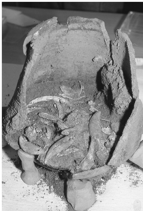
6: Et kig på indholdet i urnen.

Der var ikke andet at gøre, end at begynde at udgrave urnerne, men jo nu under optimale forhold. Ansigtsurnen kom selvfølgelig i første række. Jeg vidste jo fra ud-