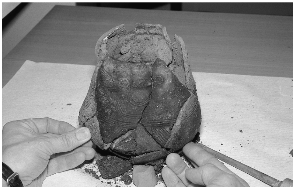
4: Urnen samles igen.

med andre ord usædvanligt tydeligt og flot, her havde keramikeren virkelig gjort noget ud af udformningen.