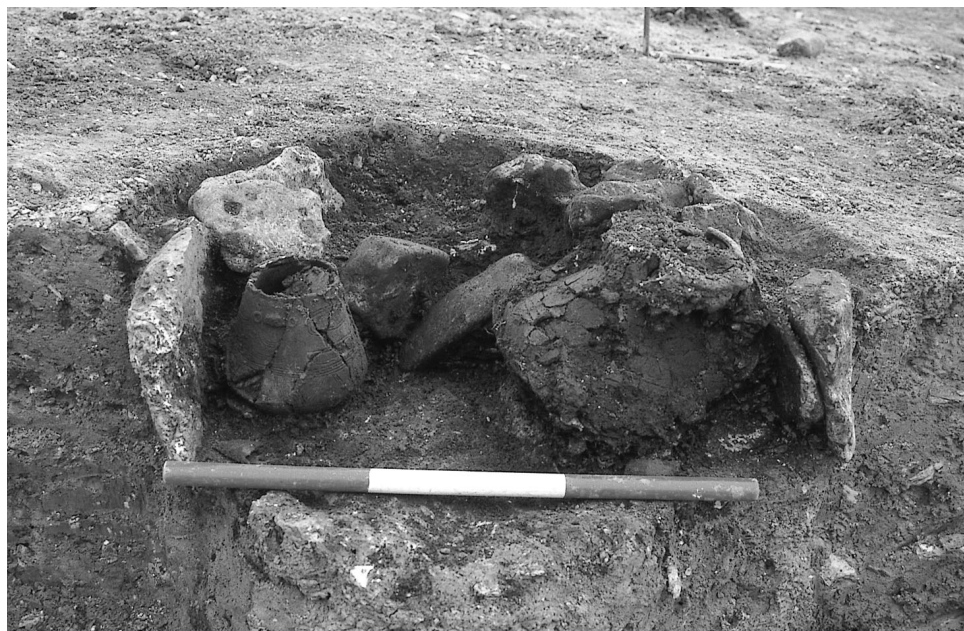
2: Udgravning af den mørke plet er påbegyndt.

Her må jeg komme med en indrømmelse. Udgravningen foregik i sidste halvdel af marts måned, og det var den pågældende dag bidende koldt med en frisk vind fra sydøst og ind i mellem småregn. Det var ikke det optimale vejr at grave i, men som arkæolog kan man ikke altid selv vælge tidspunktet for en udgravning. I dette