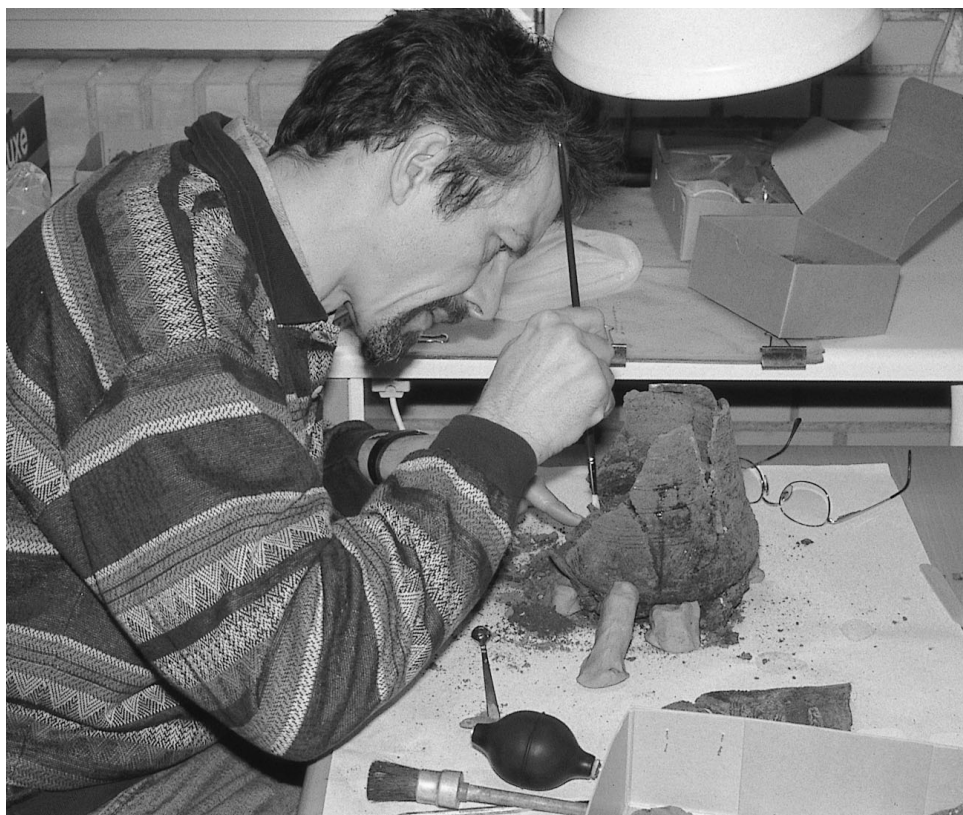
5: Udgravning af fyldet i urnen – indendøre.

urner, men må også betragtes som sjældent. Nok så spændende var det, at jeg under indsamlingen af materiale til min bog, var stødt på et fund, der sidst i 1800-tallet var blevet indsendt til Nationalmuseet. Fundet var gjort i en urne (der desværre ikke er bevaret) og bestod bl.a. af brudstykker af en udskåret, aflang genstand af ben, der givetvis har været ornamenteret med et mæanderbånd, der lignede det på ansigtsurnen. Der er formodentlig tale om et smykke, der måske har hængt ned på brystet af en kvinde i en halskæde. Og hvor var dette fund så gjort? Såmænd i en anden af Kjellinghøjene kun 200 m fra ur-