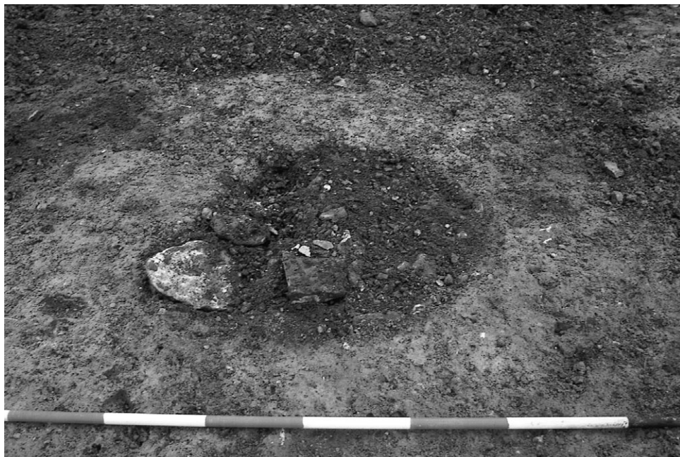
1: Den mørke cirkelrunde plet.

det skulle være noget tilbage af højen, bortgravede en rendegravemaskine pløjelaget i en 2 m bred bane tværs hen over det sted, hvor jeg troede højen havde ligget. Og som frygtet viste det sig straks, at der ikke var mere tilbage af selve gravhøjen. I den afrømmede bane fremkom dog en del af en grøft, og selv om det ikke umiddelbart så ud, som om der havde stået randsten i grøften, var det dog nærliggende at tro, at grøften havde noget at gøre med den forsvundne høj. Derfor afrømmede maskinen pløjelaget i det område, hvor grøften fandtes, for det kunne jo tænkes, at der stadig var spor tilbage efter en grav. På dette tidspunkt i udgravningen vidste jeg stadig ikke hvornår den oprindelige høj var blevet opført, og det kunne jo tænkes, at der var tale om en stenalderhøj og at den oprindelig var blevet rejst over en grav, der var ble-