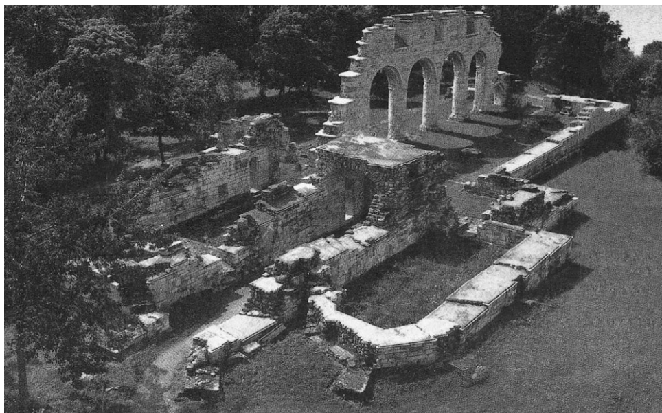
Hamar Domkirkes ruin.

Tore var biskop af Hamar siden 1189/90 og havde såmænd studeret i Paris sammen med Abbed Vilhelm af Æbeltoft. Sverre, der var opvokset i huset hos Færøernes biskop og selv uddannet præst, må have vurderet ham som den bedst egnede forhand-