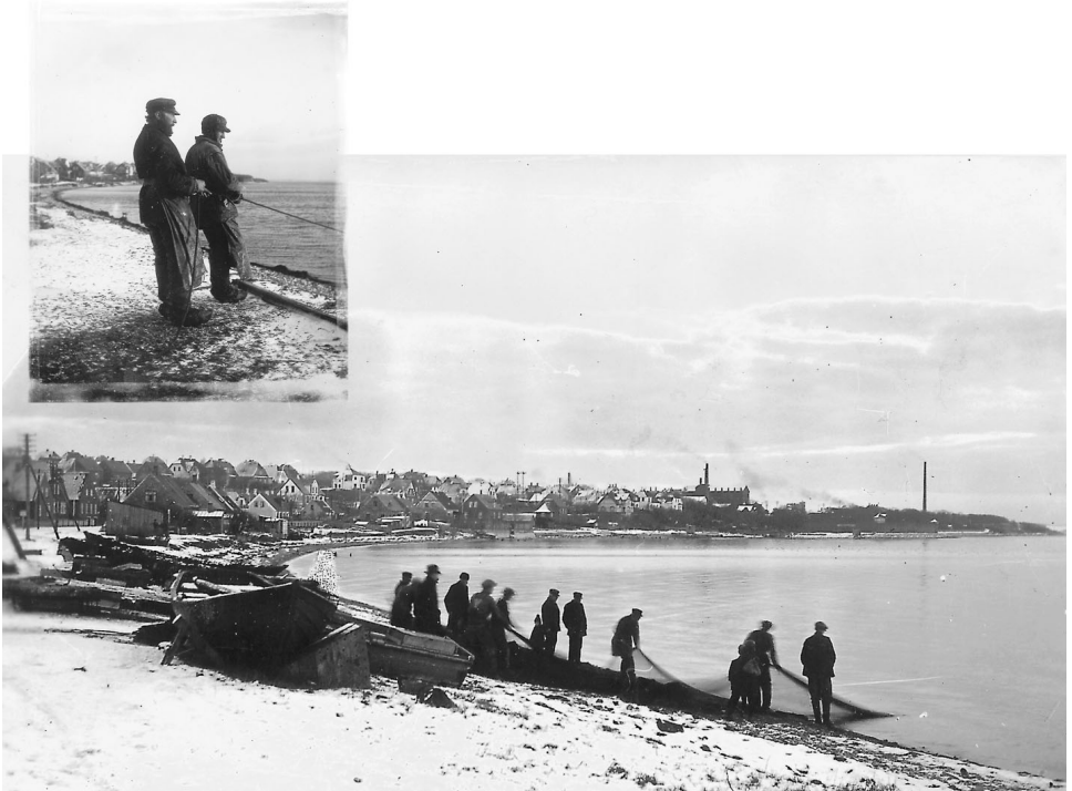
Der drages våd ved Dragsbæk ca. 1915.

der blev indmeldt om vinteren, blev døbt én gang i frostsne og én gang i tøsne. Den første gang var ikke slem; man blev stillet op i et hjørne af plankeværket – trøjekraven op om ørerne – og alle skolens drenge bombarderede én med snebolde i ti minutter. Den anden gang var værre, tøsne, kvadderbolde, hårde som sten. Man fik lov at tage sin vinterfrakke over hovedet, men drengene sigtede efter knæhaserne, og før eller senere, når to hårde kvadderbolde samtidig ramte haserne, faldt man uvægerlig om kuld, og så blev den ulykkelige bombarderet, til der ikke var meget liv i ham. Var man en rask dreng, der ikke græd eller hylede op, blev man kammerat med alle drengene og havde selv lov til at være med til den næste dåbshandling. I modsat