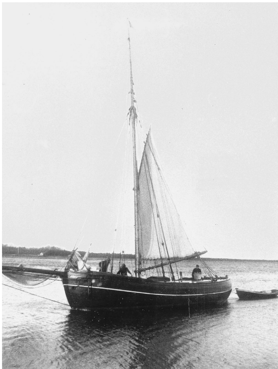
Fiskerikontrollens krydser »Ægir«, bygget i Aalborg 1886. Krydseren havde fast station i Thisted. Her fotografert i 1900.