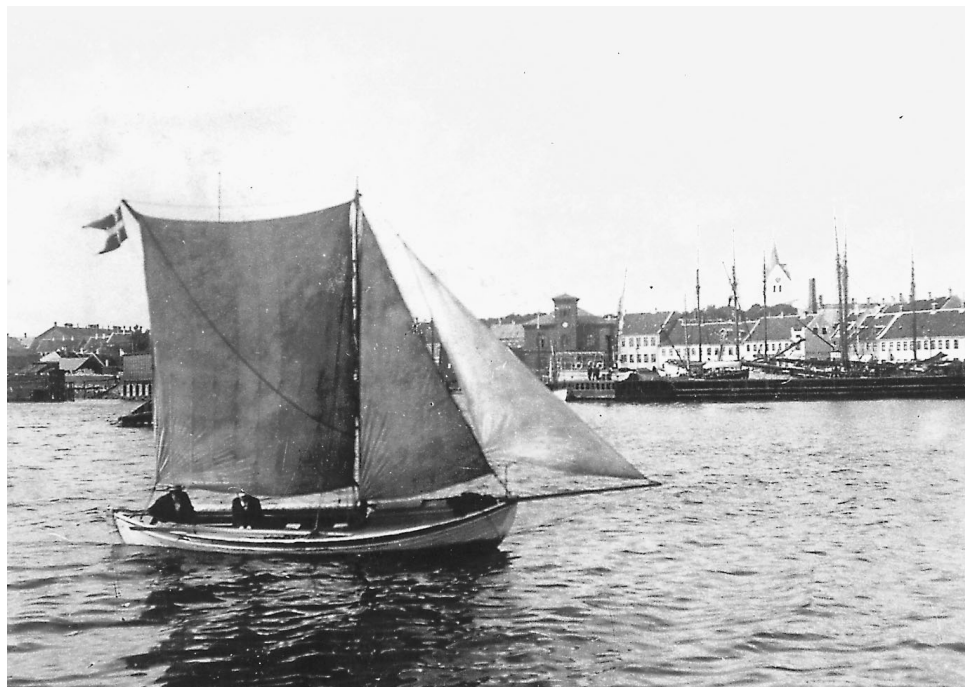
Sjægt for fulde sejl ud for Thisted Havn, 1907. Sjægten blev almindelig udbredt i Limfjorden efter 1850. Den velsejlende båd, efter sydnorsk forbillede, blev en velfungerende arbejdsplads for 2-3 fiskere.