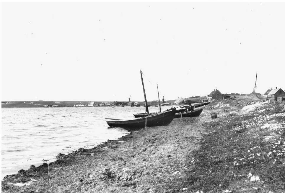
Sjægte på strandkanten ved Dragsbæk. Under rolige forhold var det bekvemt at lande sjægtene nær stejleplads og bolig. (Limfjordsmuseet, Løgstør).

saltvand, serveret med smørsovs og kartofler. Bagefter sidder vi ved kaffen nede i kahytten, har fået ild på piberne, og medens dagen sagte lægger sig til hvile og skumringen breder sig, beder vi kontrolløren fortælle lidt om sig selv.