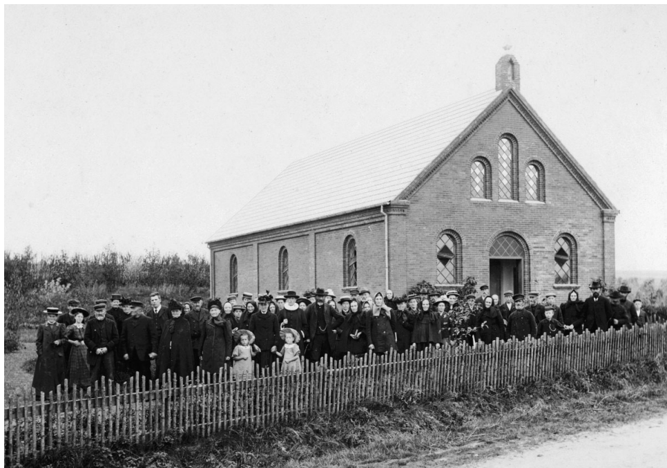
Menigheden forsamlet uden for Thorsted Frimenighedskirke ved kirkens indvielse i 1906.

gaard som præst i fællesskab med Thorsted. Men Hundborg gik endnu engang deres egne veje og fik etableret et samarbejde med præsten for Bøvlingbjerg