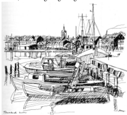
Tegning af Thisted Havn med byprofil og kirke.

Thisted var i middelalderen en ganske beskedne by, nærmest en landsby. De betydende byer i middelalderens Thy var Vestervig, Sjørring og Hillerslev. Byerne med de store kirker, klostre og borganlæg.