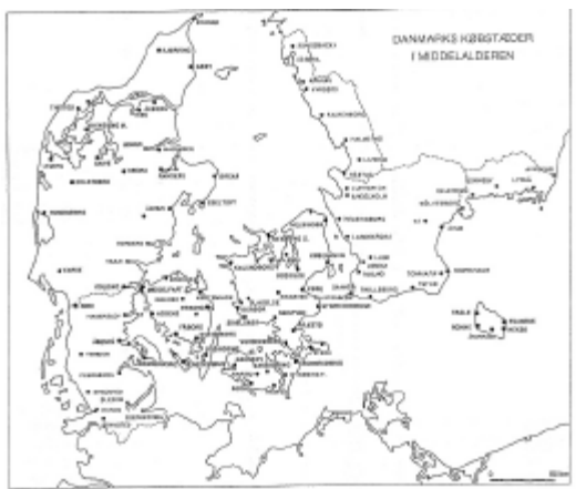
Kort over de middelalderlige købstæder i Danmark. Efter A. André: Den urbana scenen. Lund 1985.

To forhold karakteriserede købstædernes fysiske placering i landskabet. De skulle ligge nogenlunde centralt i forhold til deres handelsopland, og de skulle ligge ved vandet, som var den primære færdselsåre indtil langt op mod vor egen tid.