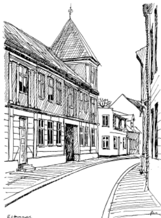
Tegning af Østergade.

Længst mod nord, nede ved bækken ved de nuværende Vinkelstræde og Strømgade, lå de mindste og fattigste ejendomme.