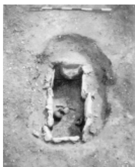
Fig. 5: Samme grav som fig. 4 efter fjernelse af dækstenene.

Stensatte grave fra ældre romertid kendes også fra andre lokaliteter i Nordthy, men dog ikke i så stort tal som på Hanstholmen. På den vestlige del af Hjørdemål knuden undersøgte Per Boe i forbindelse med vejanlæg ved Korsø i 1958 for Thisted Museum ialt tre mindre kalkstenskister, der alle er nøje parallellere til de allerede beskrevne. Den hidtil største samling af stenkister uden for Hanstholm