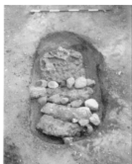
Fig. 4: Stensat jernaldergrav med velbevarede dæksten. Afdækket forud for opførelsen af V. Vandet Skole.

I årenes løb er der til Thisted Museum og Nationalmuseet i alt indkommet oplysninger om fund af 19 stenkister fra jernalderen på Hanstholm knuden. Dette tal er givetvis kun en minimumsangivelse af, hvad der rent faktisk er blevet fundet. Således foreligger der eksempelvis oplysninger om fund af mange grave påtruffet under nedgravning af kabler i 1944 ved værnemagtens 4. batteri et par hundrede meter øst for Hanstholm Fyr (fig. 7 nr. 1). Disse grave er aldrig blevet fagmæssigt undersøgt.