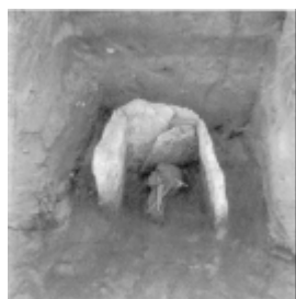
Fig. 1: Delvist ødelagt stenkiste fra ældre jernalder i 1943 øst for Brunbjerg.

Under værnemagtens anlæg af befæstningsværker i Hansted blev ved flere lejligheder fundet oldtidsfund. Således i 1943, hvor der under gravning af løbegrave umiddelbart ovenfor Hanstholm knudens sydskrænt, lidt øst for Brunbjerg og godt 1,5 km øst for Hanstholm Fyr, blev påtruffet 4 stenkister fra ældre romersk jernalder (fig. 7 nr. 3). Hvad der var tilbage af disse grave blev i oktober 1943 undersøgt for Nationalmuseet af arkæologen, senere professor, Carl Johan Becker, der i Thy-sammenhæng er mest kendt for sine udgravninger af flintminer i Hov i 1950'erne.