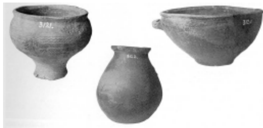
Fig. 3: Lerkar fra stenaldergrav undersøgt i august 1927 hos gdr. Chr. Madsen, Ræhr.

Den 4/8 undersøgte Museet Fundet ved undertegnede. Fundstedet var Matr. nr. 33, Ræhr Sogn, tæt ved Sogneskillet til Hansted Sogn, umiddelbart ved Skrænten af det Højdedrag, som udgør „Hanstholmen”.