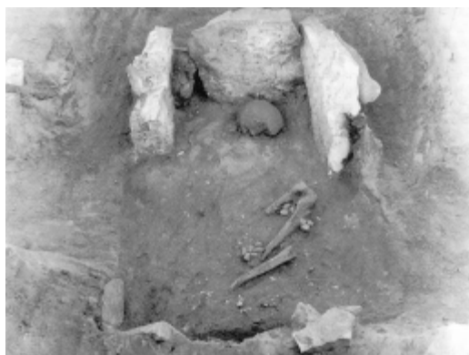
Fig. 2: Stenkiste fra ældre jernalder gennemskåret af løbegrav øst for Brunbjerg i 1943.

knæhøjde fandtes 12 små blanke strandsten, der lå fordelt i tre grupper (to med hver tre sten og én med seks sten). Kisten, der var bygget af tynde kalkstensfliser, havde en indvendig længde på kun 1,1 m (bredden varierede fra 0,55 - 0,7 m). At det til trods for størrelse ikke drejer sig om en barnegrav, godtgøres af knoglebestemmelser foretaget på Nationalmuseet, hvor den afdøde er bestemt som en voksen mand (Sellevoed et al. 1984, 91).