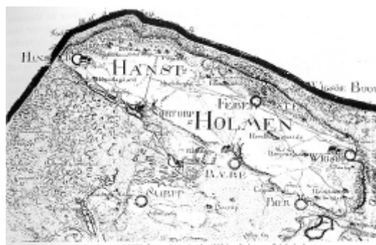
Fig. 8: Hanstholmen i slutningen af 1700-årene. Forarbejde til Videnskabernes Selskabs kort.

De to næste fund af boplads karakter stammer begge fra Nytorp og er markeret på fig. 7 som henholdsvis nr. 8 og 9. Tæt vest ved Trælshøj blev i 1971 under gravning af køkkenhave påtruffet boplads, hvori der bl.a. blev fundet brudstykker af et stort forrådskar samt anden keramik fra tiden lige omkring Kristi fødsel. Løst i overjorden fremkom endog en lille jernkniv fra formentlig samme tid. Senest er i august 1998 ved kabelarbejde tæt ved vandværket i Nytorp fundet lerkarskår fra ældre romertid. Ved en besigtigelse kunne det konstateres, at der i de sandede boplads lag på stedet også fandtes et par tynde vandrette lag af granuleret kridt, som sikkert, i lighed med