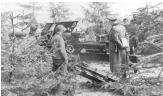
10,5 cm feltkanon af tjekkisk fabrikat fotograferet i Hornbæk Plantage nær Helsingør i april 1940. Det var et søsterbatteri til det feltbatteri, som blev opstillet på Hanstholm.

Forsvaret af kysterne var i princippet den tyske flådes opgave. Det var imidlertid vigtigt, at kanonerne var skudklare så hurtigt efter besættelsen som muligt. Og her havde flåden et problem: Stort set alle dens kystbatterier var nemlig udstyret med ældre skibskanoner, som skulle monteres på betonfundamenter, før de kunne affyre så meget som et eneste skud. Den tyske flåde rådede kun over et enkelt batteri, som kunne være indsatsklart, så snart det nåede frem. Det drejede sig om et batteri, „Gneisenau”, som var udstyret med fire ældre 15 cm skibskanoner monteret på jernbanevogne. Kanonerne havde en rækkevidde på 18 km.