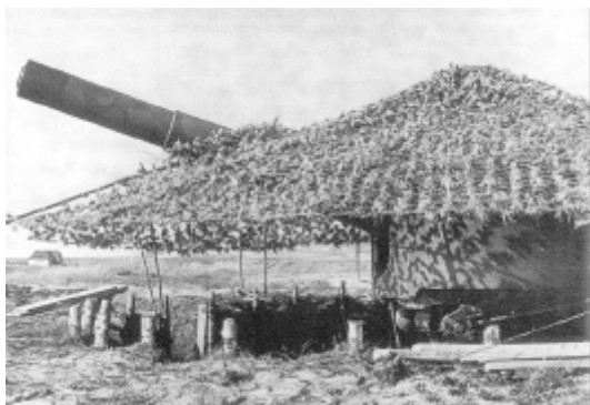
Tysk 17 cm kanon i batteriet i vildtreservatet neden for Hanstholm. Billedet er taget i august 1943, næppe meget har dog ændret sig ved kanonstillingen siden foråret 1940. Det var først i foråret 1944, de store kanonbunkere blev bygget.

De første oplysninger om planer for permanent kystartilleri ved Hanstholm finder vi i Gruppe XXI's operationsbefaling for „Weserübung-Süd” fra 20. marts. Heri anføres det, at flåden senere skulle lade et fast batteri opstille ved Hanstholm. Logisk set må man dog betydeligt tidligere have gjort sig overvejelser om at placere fastopstillet kystartilleri ved Hanstholm, så de mobile batterier kunne frigøres til andre opgaver.