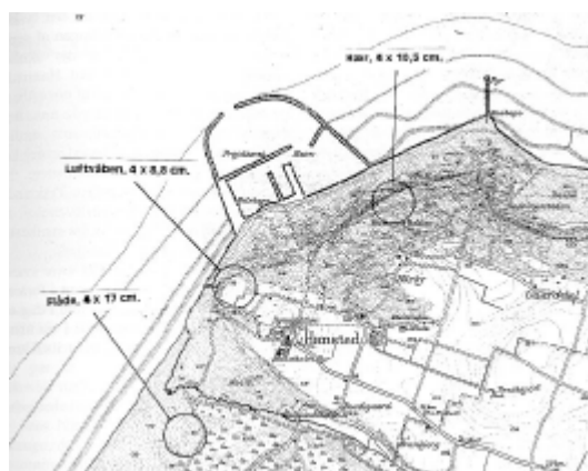
Generalstabskort over Hanstholm (1:20.000) med den formodede placering af de tre batterier i april 1940 indtegnet.

Rekognosceringsstaben ankom til Thy allerede den 11. april for at udpege stillinger til batterier ved Agger og Hanstholm. Stillingen til batteri „Schill” blev udpeget i vildtreservatet nedenfor Hanstholm, ca. 1 km sydvest for Fyret. Denne placering af batteriet kan forekomme mærkværdig, da man skulle mene, at det ville have haft større skudfelt og bedre udsyn, hvis det var blevet anlagt oppe på holmen. Dog kunne batteriet fra reservatet uden problemer dække hullet i minespærringen og adgangsvejen til det fra vest.