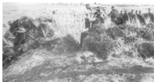
Tysk 8,8 cm luftværnskanon (Flak 36/37) tilhørende det tyske luftvåben opstillet i klitterne på den nordlige del af Fanø. Billedet er taget den 22. april 1940, og giver et indtryk af, hvordan det tilsvarende batteri på Hanstholm har taget sig ud. (Bundesarchiv, Koblenz).

De tyske landstyrker var endnu ikke nået frem til Aalborg den 9. april, da Gruppe XXI gav ordre om, at 1. afdeling af Luftwaffes 19. Flakregiment skulle afsende et svært luftværnsbatteri til Hanstholm for at lukke åbningen i minespærringen. I sin morgenmelding (kl. 10) den følgende dag til Værnemagtens overkommando oplyste Höheres Kommando XXXI, at et 8,8 cm luftværnsbatteri og et hærbatteri tilhørende Artilleriafdeling Nr. 729 var på vej mod Hanstholm, og ville ankomme samme dag.