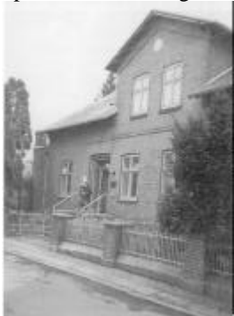
Klinikken på plantagevej bærer sin alder godt.

På grund af krigen og branden var det ikke til at opstøve et ordentligt værelse endside en lejlighed.