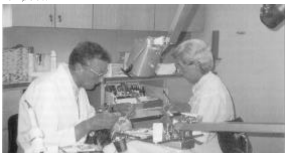
Patienten er kommet ned at ligge, så klinikassistent og tandlæge kan arbejde mere afslappet med gode oversigtsforhold. Foto 1995.

En pudsig episode kan nævnes fra hans ture til Hurup. Ret umotiveret blev toget standset på vej til Hurup. En stationsforstander havde fået en frygtelig tandpine. Da han vidste, at far skulle forbi, lod han toget standse og bad om at få tanden fjernet. Far var ikke meget for sagen, der var jo ingen plads og for kort tid. Men er man stationsforstander eller ej. Toget måtte vente til tanden var ude. Patienten satte sig på gulvet, og far lagde sig på knæ bag ved ham og holdt hans nakke ind mod sin hals. Operationen gik fint, og der blev applauderet af de medrejsende og personalet, der med spænding havde fulgt forløbet.