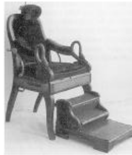
Farfars operationsstol. Bemærk svanehalsene hvorom mange hænder har grebet. Stolen kunne ikke indstilles i højden, derfor trappetigen. Nu på Thisted Museum.

indlagt elektricitet i 1905. Der var to til tre tjenestepiger, men ingen hjælp på klinikken. Der kom lejlighedsvis vaskekone og strygejomfru. Desuden var der i lange perioder forskellige svenske ammer til de syv børn, der efterhånden fødtes i huset.