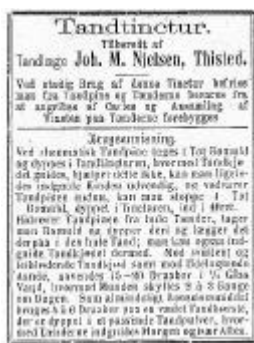
Announce om mundskyllevand, der nok lover lidt for meget.

Min far blev født 1891 og voksede op i huset på