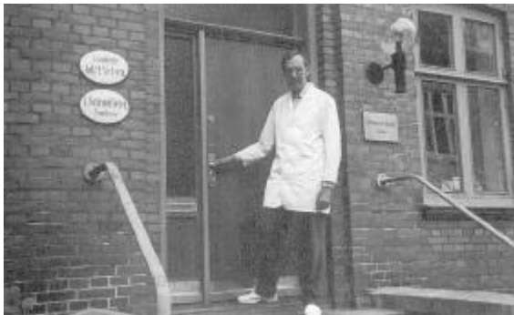
Tredje generation på trappen.

kom der sod og røglugt fra de brændte ruiner. Og samtidig må man huske, at det altid regner i Bergen, en sur kedelig regn. På det tidspunkt var der spiritusforbud i Norge, et forbud der ikke blev overholdt særlig godt. Selve forbudet gør egentlig ikke så meget. Folk kan altid skaffe sig den spiritus, de vil have, men for en ungkarl, der bor ret primitivt på et værelse, er det en stor ulempe, da der så ikke kan eksistere hyggelige cafeer og gemytlige kroer. De kan ikke leve af at sælge sodavand og kaffe, når de skal have en vis standard.