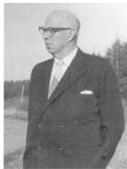
Einar N. N. var ivrig plantningsmand. Han tilplantede et hedeareal

Som regel mærkede far ikke ret meget til krigen, selv om fronten med bl.a. Verdun ikke lå så langt fra Darmstadt. Om aftenen kunne man uden for byen svagt høre kanontordenen fra fronten. Det var tragisk, når de