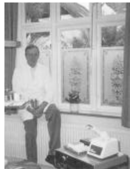
Udstyret ændrer sig, men de gamle sandblæste ruder er de samme.