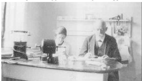
På dette billede fra laboratoriet nærmer min farfar sig de 80 år, som han nåede inden han ophørte med at praktisere.

Min farfar var ivrig havemand. I den store have, der grænsede op til anlægget Christiansgave slappede han af i