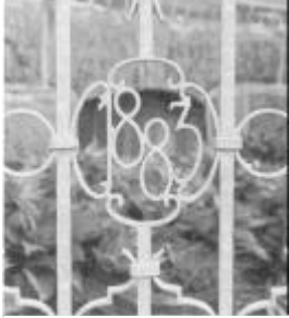
Klinikens start i smedejern.

I slutningen af sommeren 1917 sejlede far fra København til Oslo. En pragtfuld tur og med begyndende efterårsfarver i Oslofjorden var det enestående smukt. Far havde fået en stilling hos en tandlæge i Bergen, og det skulle han aldrig have gjort.