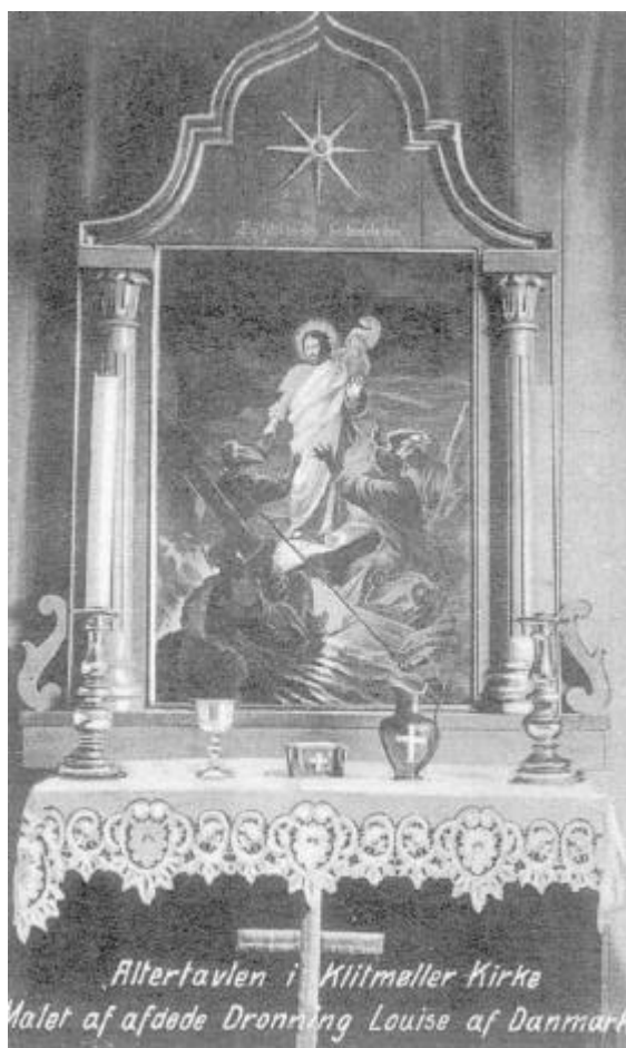
Altertavlen i Klitmøller Kirke.