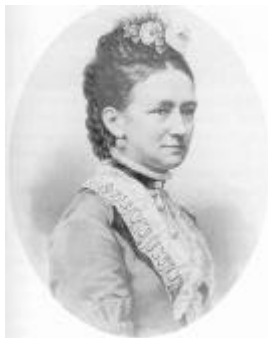
Dronning Louise, Danmarks dronning 1863- 1906.

"Kl. 3 1 / 4 tiltraadtes Tilbageturen og Veiret var nu bleven meget smukt. Det lange Vogntog - det talte nu 56 Vogne - tog sig særdeles smukt ud paa den bugtede Vei, henad hvilket det strakte sig over en halv Fjerdingsvej. Kl. 4 3 / 4 naaede Toget Thisted og modtaget langt udenfor Byen af tætte Skarer; og jo længere det naaede ind i Byen des tættere blev Menneskemængden, og hele Torvet var aldeles tæt pakket, en saadan Mængde af Landboere vare komne herind".