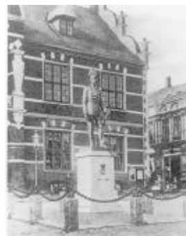
Da Chr. IX endnu herskede over Store Torv. Statuen blev afsløret af kong Fdr. VIII og dronning Louise i 1910.

N. N. har fået tre måneders fængsel for majestætsfornærmelse.