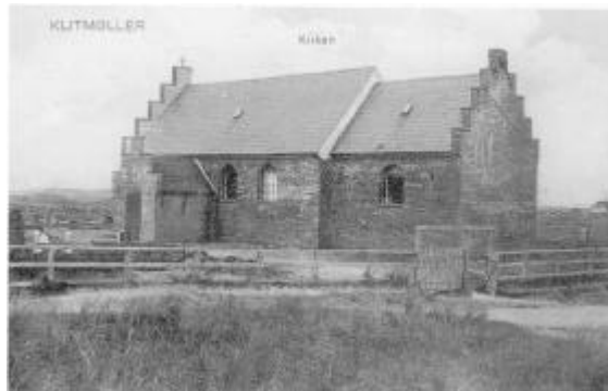
Klitmøller Kirke på kongebesøgets tid.

Reservemandskabet bares han gennem Brændingen ud i Baaden under ustandselig Jubel fra Mængden paa Stranden, som udgjorde mindst 500. Ved Landstigningen lod Kongen uddele til de 12 Mand en Dusør af 120 Kr.". For redningsmandskabet en ganske indbringende dag, idet de ud over dusøren fik den sædvanlige betaling for øvelse å 4 kr. 50 Øre pr. mand. Ved denne lejlighed bestemte kongen, at redningsvæsenet fremover skulle føre splitflag.