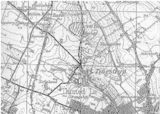
Fig. 1. Thy-kort med angivelse af Hejrhøj og området med fund ved Hejrhøjvej og Klatmøllevej.

Knakkergårds beretning er det første vidnesbyrd om arkæologiske fund i området ved Hejrhøj. (Fig. 1) Det viste sig, at Knakkergård i tidens løb havde gjort andre fund. Således havde han en hel drejekværnsten liggende,