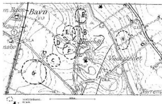
Fig. 4. 4-cm kort med angivelse af Hejrhøj, udgravningerne og de formodede landsbyfaser.

Udgravningerne har været mest omfattende ved Hejrhøjvej. Men både nord og øst for Hejrhøj og ikke mindst mod sydvest ved Klatmøllevej er der foretaget udgravninger. De ældst kendte bopladsspor er antagelig fra ældre romersk jernalder (A på fig. 4). Vi har dog ikke foretaget udgravninger på stedet, men lige på den anden side af Skinnerup enge har vi udgravet en formodet grav fra ældre romersk jernalder. Mod sydvest har vi flere andre