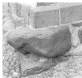
Stenen i Hillerslev kirke.