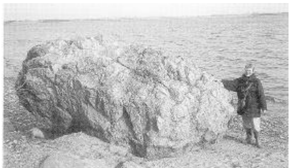
Vandrestenen ved Skyum Bjerge.