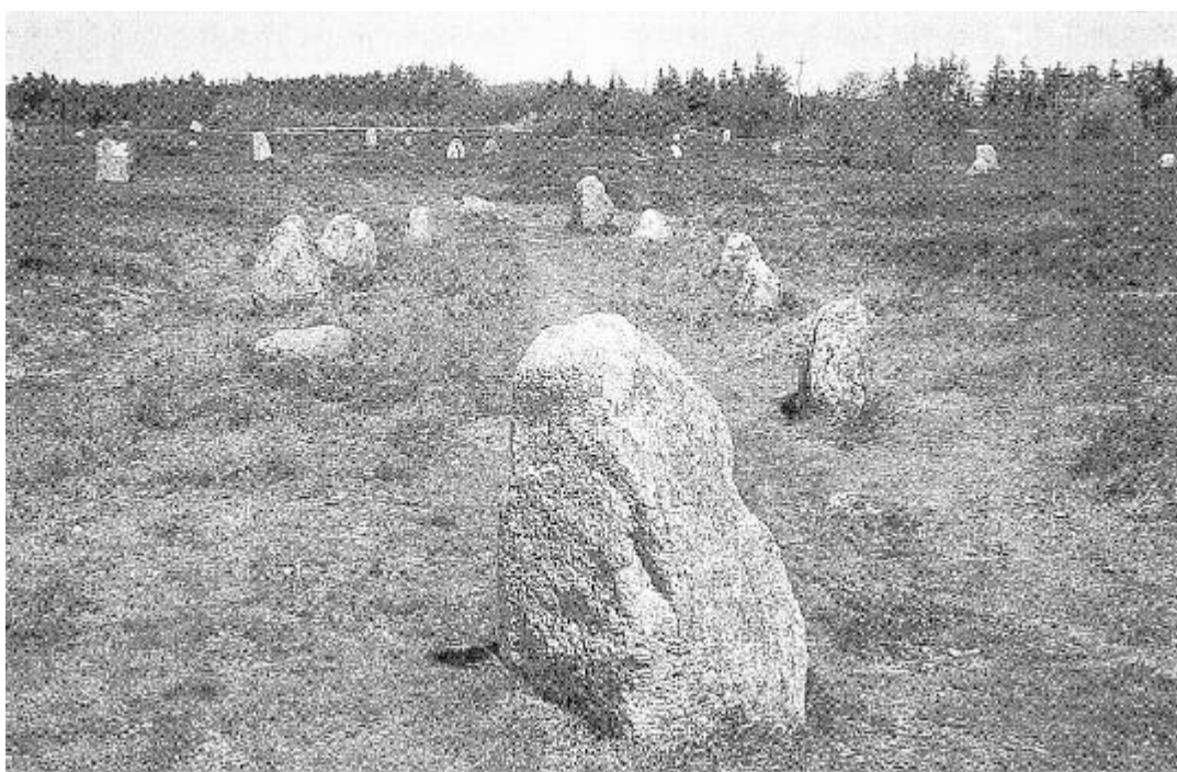
Vikingegravpladsen på Højstrup Hede ved Tømmerby.

(Kilde: Historisk Årbog for Thy og Vester Hanherred 1995, side 161-168).