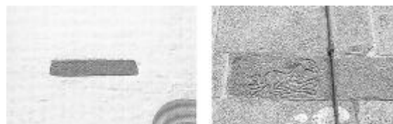
T.v.: Ligstenen i Hillerslev kirketårn.