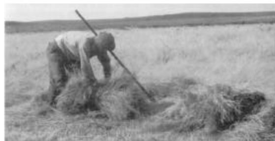
Rapgræs bindes op på Rosvang.