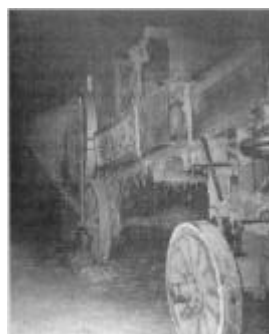
Tærskemaskine og presser på Rosvang.