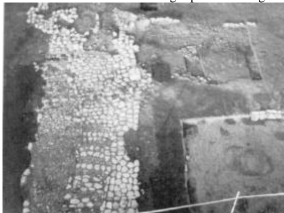
Lille jernalderhus og et fint brolagt vejstykke under udgravning ved Tåbel i Sydthy.

man på denne tid netop anvendte en enkelt række tagbærende stolper. Blot få århundreder senere begyndte man at anvende to rækker stolper til at bære taget i husene - en konstruktionsmåde, som forblev den almindelige i over tre tusinde år - altså til langt op imod vor egen tid.