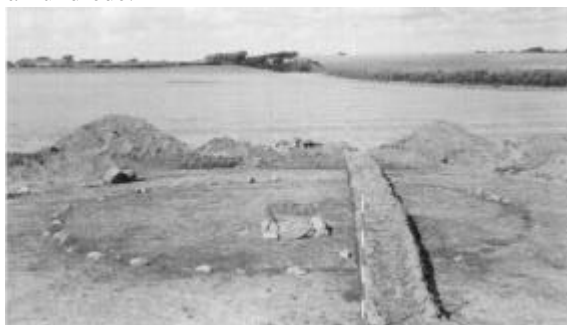
Rester af bronzealdergravhøj afdækket ved Damsgård i Sønderhå sogn. Stenkiste og ligbrændingsgrube ses i midten omgivet af sporene efter en fin randstenskæde 10 m i diam. Senere er foretaget en udvidelse af højen, hvad resterne efter endnu en randstenskæde viser.