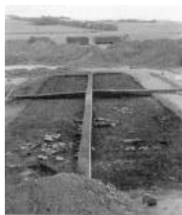
Det nedbrændte langhus fra landsbyen ved Hejrhøj set fra vest. I forgrunden ses knuste lerkar liggende på gulvet. Den korsformede balk over huset er et udgravningsteknisk kneb for at kunne holde styr på de mange jordlag in de i huset.

Udenfor gik der langs med vestvæggen på det lille hus en usædvanlig fint udformet brolægning op til et langhus nord for.