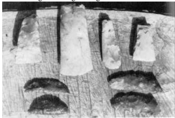
Økser og andet godt fra yngre stenalder og ældre bronzealder.

brikker i det komplicerede puslespil, der hedder: Samspillet mellem menneske og natur i Thy fra oldtiden til i dag. Det er emnet for et bredt anlagt projekt, hvor Museet for Thy og Vester Hanherred i disse år sammen med arkæologer fra England og USA samt danske