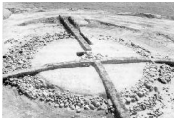
Overpløjet gravhøj fra yngre stenalder og bronzealder under udgravning ved Vibberstoft, Sydthy. Stenene i midten er en grav fra slutningen af stenalderen eller begyndelsen af bronzealderen.

naturvidenskabsfolk arbejder på at skaffe ny viden om Thy's bebyggelse og udnyttelse, først og fremmest i oldtiden, men også i middelalder og nyere tid.