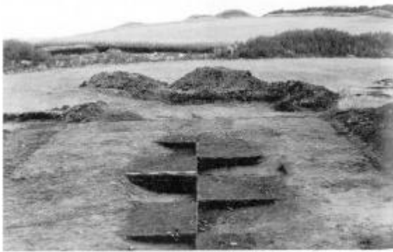
Neddybet hustomt fra slutningen af yngre stenalder under udgravning ved Bjergene, Sønderhå sogn.

Placeringen af de bopladser, vi indtil nu har fået kendskab til, viser tydeligt, at menneskene for ca. 4.000 år siden foretrak at bo på de højtliggende steder. Ofte ligger bopladserne på bakkepartier, der som næs strækker sig ud i lavereliggende områder, der f.eks. kan have været anvendt til kreaturgræsning.