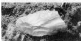
Et godt fund – en halv flintsegl fra yngre stenalderens slutning eller begyndelse af bronzealder.

Dolkfragmentet og nogle flintafslag, hvoraf et er forarbejdet til en skraber, bliver lagt i tasken og taget med hjem. Her får de påskrevet et nummer og fundstedet bliver indtegnet på et kort. Fra andre lokaliteter i området ligger andre samlinger af skraber, dolke, segl o.s.v.. Hver lokalitet har sit nummer, så det altid er muligt at se, hvor hver enkelt ting er fundet.