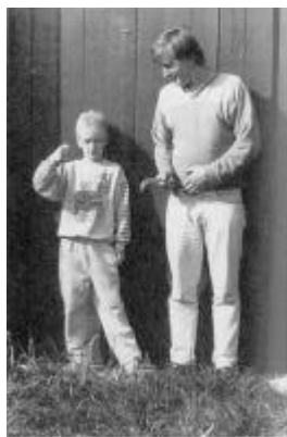
To af bidragerne til museets undersøgelse.

4.000 år siden var et efter den tids forhold tæt befolket og blomstrende område.