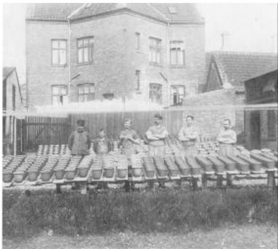
Udsnit af produktionen på Thisted Lervarefabrik, ca. 1900.

som den dygtigste svend, der havde været på værkstedet. Han var en meget dygtig drejer og god til at fremstille smukke glasurer. En del af lertøjet blev i øvrigt begittet med lyst ler fra Bornholm. Fra den tid stammer en to-øret krukke med stemplet "Thisted". Men ellers er stemplerne en sjældenhed. Det blev aldrig almindeligt at stemple varer fra Thisted Lervarefabrik.