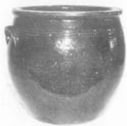
Syltekrukke med indvendig og udvendig brun begitning og klar glasur. Stemplet Thisted Lervarefabrik og R. C. Kirkegaard.

formiddag. Det var selvsagt et slidsomt arbejde. I frostvejr var det med is på ruderne og iskolde sæder.