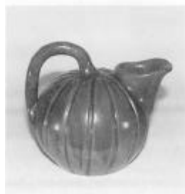
Øverst: Vase med grøn, mat glasur. Nederst: Kande i halvmat okkergul glasur med effekt i grønt. Stemplet i bunden C.-J. Haandarbejde. Danmark. Fremstillet af Chr. Jensen, Thisted. En del af Chr. Jensens produktion fandt afsætning igennem bl.a. Illum i København.