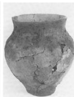
Urn fra kvindegraven.