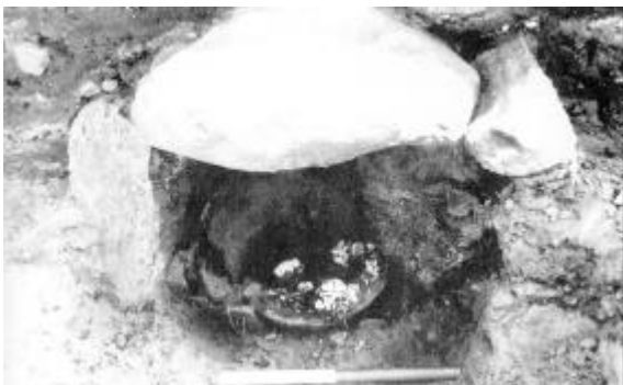
Den lillestensætning, efter at den ene side og de fleste skår er fjernet. Bag lerkarbunden med de brændte ben ses et stort skår med randen nedad.

At en femårs dreng får en regulær høj begravelse siger noget om bronzealderens samfund: Selv et barn, som ikke selv har haft mulighed for at skabe sig en position, kunne i visse tilfælde i kraft af sine slægtsforhold få en begravelse, der kun blev de øverste befolkningslag til del. En høj status har altså været noget, man kunne arve.