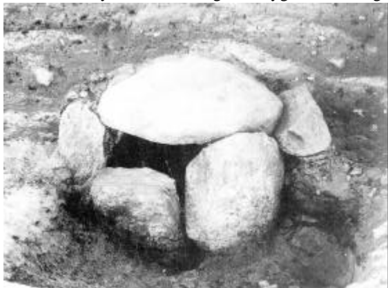
Den lillestensætning halvt afdækket.

og tænder bekræftede 1 ). Blandt de meget velbevarede tænder var en mælketand, og de blivende fortænder så slet ikke ud til at have været brudt frem. Tænderne var ret store, hvilket tyder på, at barnet var en dreng. Alderen kan sættes til omkring fem år. Ravperler kendes også fra andre af de meget fåtallige barnegrave fra bronzealderen - måske har man i lighed med, hvad der senere var tilfældet, tillagt ravet en beskyttende virkning mod sygdomme o.lign.