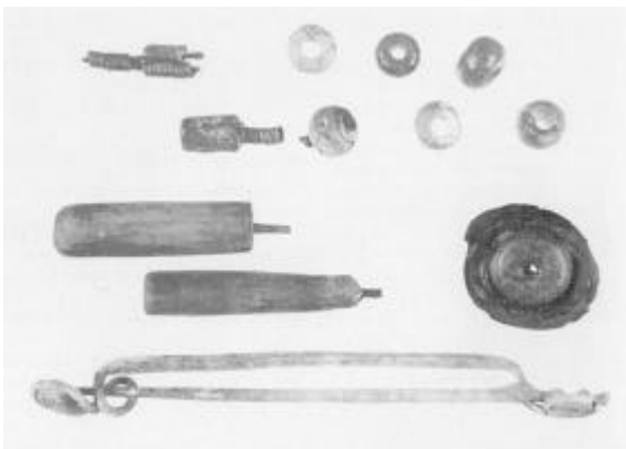
Smykker m.m. fra kvindegraven, fundet i urnen: Øverst dele af armbånd med bronzespiraler, blå og grønne glasperler og en perle af organisk materiale. Derunder to stave med træskafter og en ravperle, indpresset i en harpiksklump. Nederst den store bøjlenål af bronze.

brændte ben i alle tre grave. I barnegraven fandtes knogler af en kalv, i kvindegraven for- og bagben af et får, og i mandsgraven en del af kraniekalotten fra et større dyr, som ikke kunne bestemmes med sikkerhed 2 ). Det kan være proviant, man har medgivet de døde, som vi kender det f. eks. fra jernalderen, men måske også rester fra måltider, de efterlevende har nydt i forbindelse med begravelsen. Et makabert eksempel på et sådant offermåltid kendes fra en grav ved Stubberup på Lolland, hvor der over kisten lå knogler af mindst tre mennesker der er tolket som resterne af et måltid bestående af menneskekød. I Thy har man dog holdt sig til husdyrene.