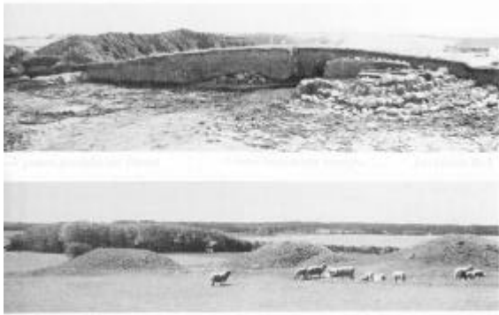
Øverst: Snit gennem gravhøjen ved Thisted. Stendyngen på højens bund dækker barnegraven. Nederst: Fredede gravhøje ved Vandet Sø.

vi her allerede er rykket op i de voksnes rækker - højen med stensætningen er endda usædvanlig imponerende sammenlignet med de fleste voksengrave. Det må dog stadig være den medfødte status, der har været afgørende, da man valgte at opføre et så arbejdskrævende mindesmærke over en teenager. Også denne høj blev genbrugt til senere begravelser, men uden at der blev bygget videre på den - den har åbenbart været anset for at være stor nok i forvejen. Igen var det en senere tilkommet grav, der rummede det rigeste udstyr - en fornem kvindegrav med bl.a. en guldspiralring og en bronzebæltedåse, der indeholdt et armbånd af glasperler og bronzespiraler, den nærmeste parallel i Thy til Egshvilekvindens smykke 3 ).