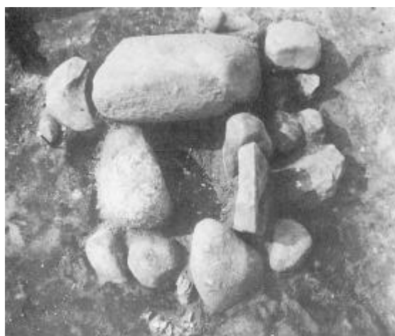
Barnegraven fra Villerup.

I en høj ved Villerup i Sydthy fandtes i centrum, i en lille kiste der minder om den kistelignende stensætning omkring Egshvile-drengens grav, de brændte knogler af et kun 10 mdr. gammelt barn. Også her var gravgaverne meget beskedne - en lille bronzeknap og et stykke tekstil var alt, hvad der blev fundet og højen var ganske lille, kun 4,1 m i diameter. Senere fulgte i alt fire højfaser og fem grave, hvoraf en var en veludstyret mandsgrav med et bronzesværd i træskede.