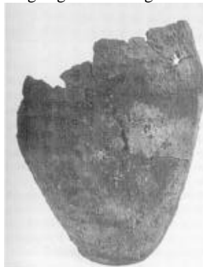
Urn fra barnegraven efter konservering.

Drengen fra Egshvile blev ikke alene højlagt, han var også den første gravlagte i en høj, som senere kom til at rumme meget fremtrædende personer. Eksemplet er ikke enestående i Thy - i to andre tilfælde kendes høje, hvor den ældste grav er en barnegrav, der blev efterfulgt af langt rigere voksengrave.