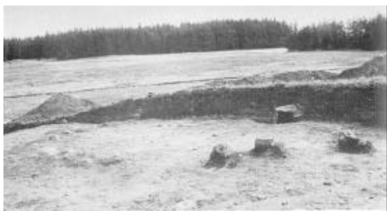
Snit gennem den overpløjede gravhøj med barnegraven. I forgrunden ses spredte sten fra fodkransen omkring høj nr. 2.

En helt speciel type gravgave, som ikke har været omtalt endnu, er rester af dyreknoabler, som blev fundet blandt de