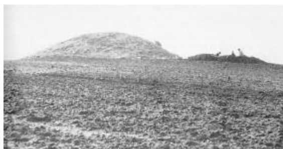
Fra forårets udgravning. Direkte syd for den overpløjede høj ses en stor, velbevaret fredet gravhøj.

Den grav, der fremkom nær højens centrum, var imidlertid ikke en kiste, men en lille kistelignende stensætning, og lindede man lidt på en af stenene, kunne der skimtes store lerkarskår indenfor. Det så ved første øjekast ud til at være en senere nedsat urnegrav fra yngre bronzealder - et noget skuffende resultat sammenlignet med, hvad vi havde håbet at finde. Et nærmere studium af jordlagene i den profilvæg, man altid lader stå tilbage midt gennem højen, viste imidlertid klart, at urnegraven måtte være anlagt, inden højen blev rejst, og det gjorde med ét slag højen til et langt mere spændende oldtidsminde end først antaget.