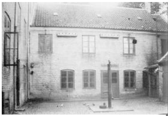
Bendixsens Tobaksfabrik, Skovgade, ca. 1895 – fra Skovgade og fra gården