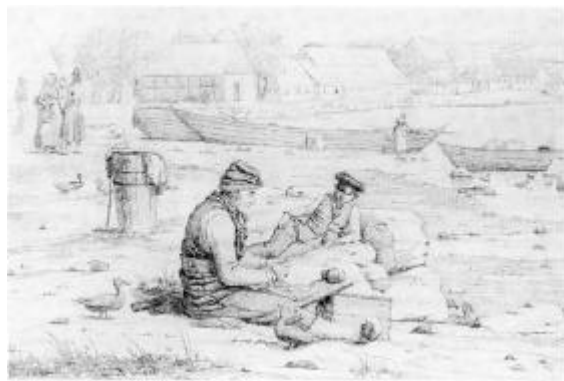
Martinus Rørbye's tegning af "Fiskere i Thisted", 1830. Fiskeren agner (madder) kroge, mens drengen ser til. Under Bjerget, senere Strandvejen, som ses på tegningen, havde med sin beliggenhed en tæt tilknytning til havnelivet, og det var den vade i Thisted, der beboedes af flest fiskere.

halvdel af august. Årsagen hertil var, at pulsvodfiskeriet blev betragtet som hårdhændet og skadelig for krogfiskeriet, hvilket også gav anledning til sammenstød mellem fiskerne fra Agger-Harboøre og Limfjordsfiskerne, f.eks. kendes et tilfælde fra Thissingvig på Sydmons fra 1839, hvor fiskerne tørnede sammen i et søslag om fiskeretten 2 ). Desuden kunne Østerildboerne forsyne omegnen med ferske og røgede helt. Det var kun få rødspætter, man fangede, og det gode sildefiskeri i den østlige Limfjord med Nibe som centrum fandt ikke sit sidestykke i Thisted Bredning.