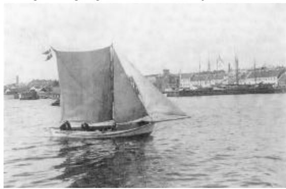
Limfjords-sjægt udenfor Thisted Havn. Sjægten var den dominerende bådtype i fiskeriet på Thisted Bredning indtil efter 1900, hvor motorer i bådene stillede andre krav til sejldygtigheden. Det karakteristiske ved sjægten er den tilsnidsede stav båd foran og aeter.

Et andet eksempel på den begyndende industrialisering af fiskerierhvervet var oprettelsen af Thisted Fiskefaktori, der blev indviet i maj 1886, og formodentlig var den første fiskefabrik i Thy. Initiativtager og ejer var justitsråd Hansen, der på hjørnet af Søndergade og Fjordstræde indrettede ishus, rensningshus og røghus med 34 fod høje ovne i 2