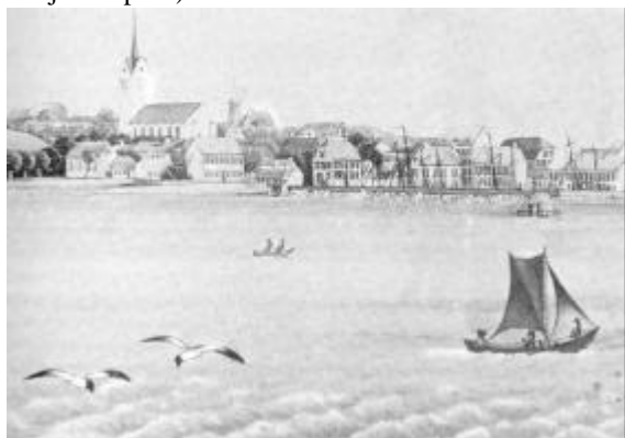
Akvarel fra 1850 af ukendt kunstner. Thisted by med havnen omtrent som det må have set ud fra en fiskerbåd på fjorden. I forgrunden ses en forenklet udgave af en Limfjordssjægt.

Thisted Byfogedkontor, den 28. sept. 1855. Schjellerup 15) .