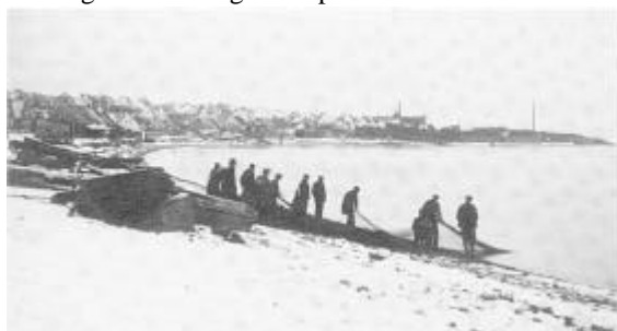
Landdragningsvod-trækning efter sild ved Dragsbæk ca. 1919. Voddet roedes ud på fjorden, hvorefter fiskerlaget ved hjælp af lange reb drog voddet på land. Denne gamle fiskeform, der bl.a. også var bærende for Skagensfiskeriet, overlevede i mange år i Dragsbæk.

for fiskeriforeningen i mange år frem, og foreningen blev dermed den økonomiske igangsætter af rødspætteudplantningen, som hovedparten af indtægterne gik til. 334½ ol rødspætteyngel kunne således udsættes i Thisted og Visby Bredning i april-maj 1893. Og den udsatte mængde var året efter i 1894 steget til 512½ ol eller ca. 40.000 kg.. De følgende år blev lignende mængder udplantet.