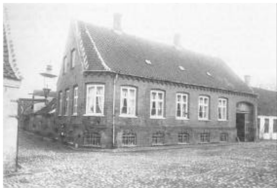
Thisted Fiskefaktori, 1900-10, på hjørnet af Søndergade og Fjordstræde. "Fiskerifaktori" står skrevet over porten. Huset er for længe nedrevet og giver i dag plads for det nye rådhus.

I Dragsbæk fandtes en gruppe af fiskere, der i mange år vedblev med at drive landdragningsvod-fiskeri efter sild, hvilket var en af de mange særlige fiskeformer, som har eksisteret.