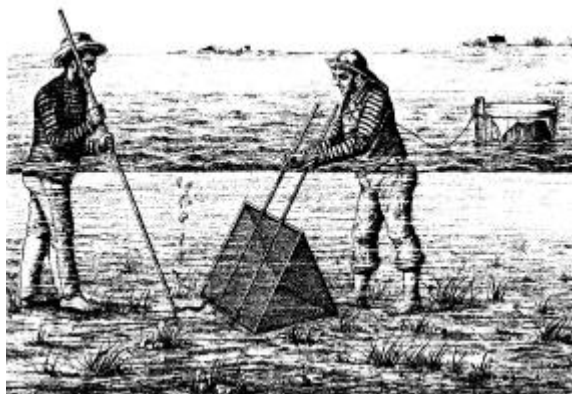
Åleglibe tilhørte sammen med ålestangning vadefiskerierne, som var almindeligt omkring Thisted Bredning. Denne fiskeform blev ofte drevet af folk med et andet hovederhverv, som derved tjente en ekstra skilling eller skaffede fisk til eget behov. C. F. Drechsel, 1890.

både med 5-mands besætning, heraf fandtes på hver båd 2 dykkere. Dykkerne fik som betaling 1¼ øre pr. østers, mens resten af mandskabet var på dagløn. Og udbyttet var pr. dag pr. båd omtrent 800 stk. I samme forbindelse blev der klaget over at bankerne under Kirkegårdsbakkeme var overfiskede, men man forventede et bedre udbytte ved Mallehage. 23 ) Firmaet Tonning og Co., Nykøbing organiserede dykkerfiskeriet bl.a. ved leje af fartøjer og oplæring af "unge, sunde og raske mænd" til dykkere. 24 )