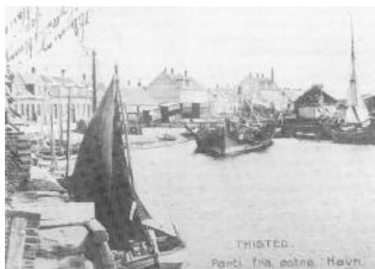
Thisted østre havn, 1900-10. Østre havn fungerede som fiskerihavn indtil bygningen af slagteriet i 1930. På fotoet ses bådebyggeriet med en gammel bark under ophugning samt hyttefade opstabled bagved på land. Til venstre ses ved kajen en sjægt og flere hyttefade. I baggrunden ses Strandvejen – sammenlign i øvrigt med M. Rørby's tegning, der er fra omtrent samme sted.

Fiskeriforeningens generalforsamlinger, hvor de lokale fiskere ønskede at beskytte bestanden med skrappe bestemmelser, i modsætning til de udenbys - der ikke havde samme interesse.