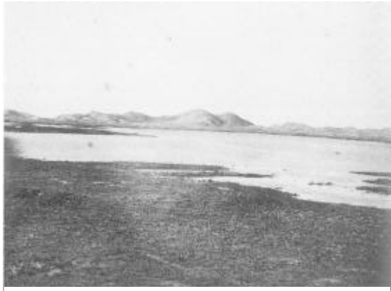
Fig. 1. Den vestlige del af Sjørring Sø under udtørringen. Fotografiet findes på museet under museumsnr. THY B.815.

Indtil midten af 1800-tallet lå Sjørring Sø stor og mægtig, og strakte sig fra Sjørring i øst til Snejstrup i vest (fig. 1).