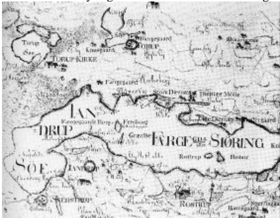
Figur 2. Udsnit af forarbejde til Videnskabernes Selskabs kort fra 1790'erne. Vikingetidsbopladsen er beliggende på nasset nord for Jandrup by og sydvest for Fersborg eller Færgegaards Borg.

I søens vestlige del lå en ø, hvorpå tilflugtsborgen Fersborg eller Færgeborg var placeret (fig. 2). Undersøgelser ved borgen, og fund af våben, viser at borgen må være opført i slutningen af jernalderen, og det er således sandsynligt at den har eksisteret i vikingetiden. 1)