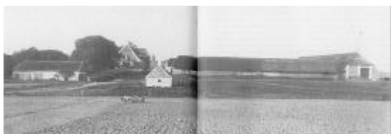
Nørhågd, set fra øst med mølle i baggrunden. Billedet er udateret.

I 1784 havde udskiftnings tanken ikke haft meget fremgang omkring de 27 nordvestjyske hovedgårde. Den væsentligste årsag dertil angiver lodsejerne i 1784 til at være et økonomisk spørgsmål. Om årsagen til at udskiftning ikke allerede har fundet sted berettes det fra godserne: