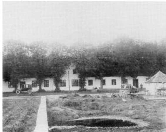
Hovedbygningen, Gl. Ullerupgård, Sennels, ca. 1920.

1785-indberetningerne giver også et billede af det stade, som den såkaldte ”fabriksvirksomhed” befandt sig på i og omkring hovedgårdene.