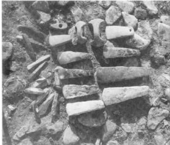
(Fig. 2) Fund fra jættestuen ved Gadegård, Helligsø Sogn.

fornemt udstyret kvindebegravelse. Gravgaverne bestod af en guldfin gerring, en smuk halskæde af glasperler og tre fibler - en slags sikkerhedsnåle til at holde tøjet sammen med. Den ene af fiblerne var forsynet med forgyldt sølvblik og glasindlægninger og har derfor også tjent som smykke. I graven lå endelig også en jernkniv og en bronzetenvægt. Med dette udstyr er der ingen tvivl om, at den gravlagte har tilhørt datidens mere velstillede del af befolkningen.