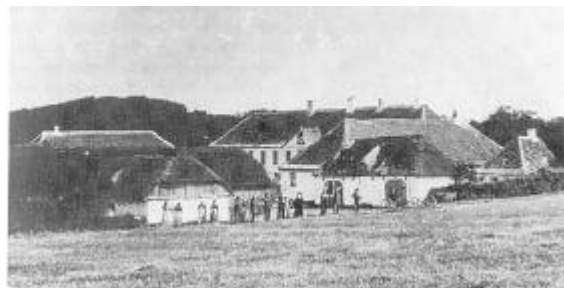
Kølbygaard set fra syd, ca. 1910.