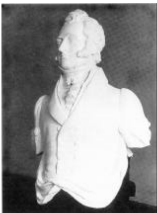
Galionsfigur, som i mange år stod i haven på Kølbygaard. Den findes nu i Handels- og Søfartsmuseet på Kronborg.

ud af havedøren og i halvmørket så den hvide galionsfigur ved flagstangen, sagde hun: - Herregud, den store figur er der endnu.