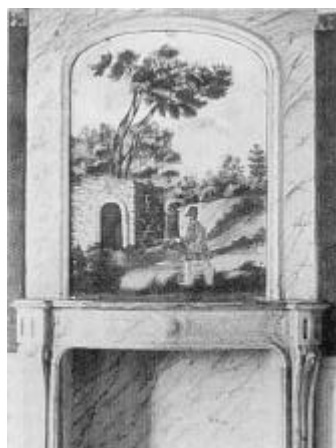
Marmorkaminen på Kølbygaard. Kaminestykket er et maleri med jagtscene efter udenlandsk forbillede.

. og Jacob Andersen 5 ) skriver om Kølbygaard: ”Det er et stykke udviklingshistorie, man gennem denne forandring er vidne til, et ikke helt almindeligt nivelleringsforetagende, al den grund, der slet ikke er noget tilbage af hovedbygningen eller den ca. ti tdr. land store, smukke have. På de fleste store gårde, der er udstykket, har man dog beholdt hovedbygningen, mens der her ikke er ladt sten på sten tilbage. ... Men en ting kan jeg ikke forlige mig med, nemlig at man så ganske har udslettet den store have med dens mange pragtfulde, århundredgamle træer. Dette er nemlig i det så træfattede Thyland nærmest for en vandalisme at regne.”