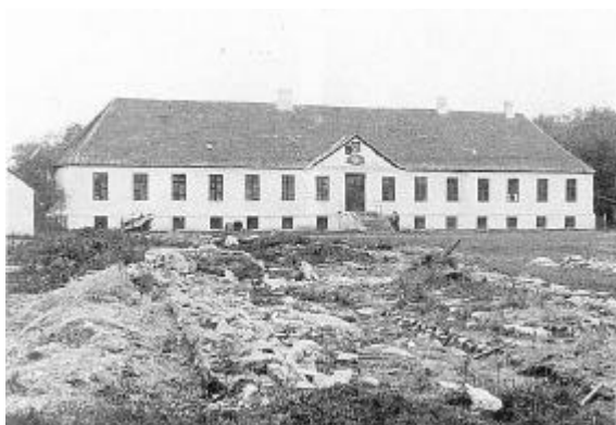
Fotografi af Willum Berregaards hovedbygning fra 1766. I forgrunden ses tydelige spor af den påbegyndte nedbrydning af anlægget. Det begyndte med gårdens salg til udstykning i 1916 og sluttede med hovedbygningens nedrivning i 1918-19.