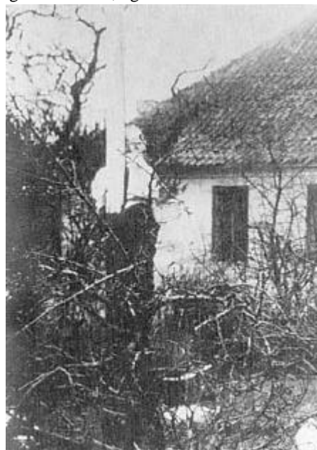
Haven på Kølbygaard med flagstang og den store galionsfugur. Foto før 1919.

mormor lod en af pigerne fyre op i et af værelserne i den høje kælderetage. Da konen havde spist, bad hun om lov til at se gårdens stuer, og mormor viste hende selv rundt.