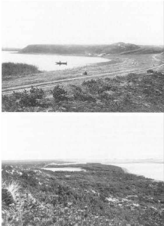
Landskabet ved Nors Sø, ca. 1890. Et resultat af sandflugten.