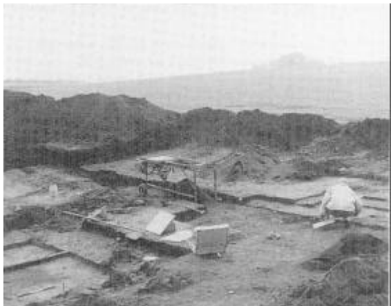
Udgravning af boplads fra yngre stenalder ved Ås. På grund af de mange små flintafslag blev jorden soldet på det motoriserede sold midt i udgravningen.

Flere af de bopladser, som blev fundet på naturgas-tracéen, stammer fra perioder, hvor kendskabet til oldtidsbebyggelsen i Thy er meget lille. Blandt overraskelserne var en boplads tæt ved langdyssen Vilhøj