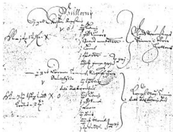
Uddrag fra matriklen i 1664 med Vestergård først og Vesterlund som nummer 10. Der betales stadig ledingspenge, og landgilden er næsten uændret fra 1562.