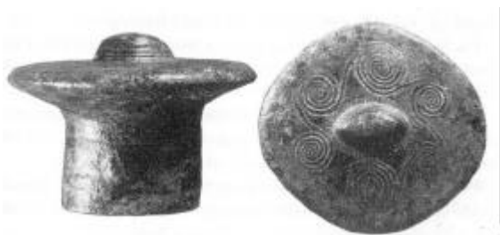
Fig. 4: Spiralornamenteret fæsteknap til bronzesværd fra Sperring..

Fra Antikvarisk Samling i Ribe har museet modtaget en række oldsager, som er blevet opkøbt i Nordvestjylland først i dette århundrede. Om genstandene foreligger sædvanligvis kun oplyst, at de er fundet indenfor området Thy, Thyholm, Mors. Det var derfor helt uventet, at det viste sig muligt at knytte et bestemt fund til en bestemt gravhøj i Thy.