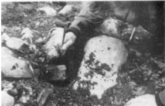
Fig. 12: Lerkar fra dyssetomt ved Møgelvang, Skjoldborg Sogn under frigravning. (Foto: Jens-Henrik Bech).

Som omtalt i Historisk Samfunds årbog for 1985 har museet i Skjoldborg sogn undersøgt et ødelagt dyssekammer i en overpløjet langdykke beliggende ved gården Møgelvang. Under arbejdet på stedet lagde udgraverne mærke til opløjede sten og kalkstensplader i sydenden af Langdykken godt 40 meter fra det afdækkede kammer. Stenene viste, at der måtte findes rester af endnu et dyssekammer i højen.