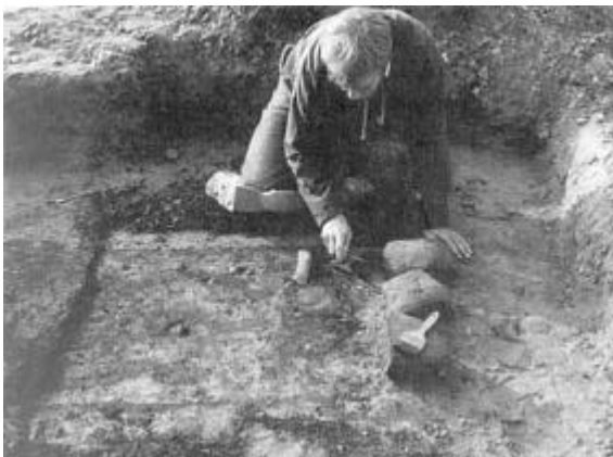
Fig. 2: Mandsgrav med stridsøkse fra Faddersbøl, Hundborg Sogn. (Foto: Jens-Henrik Bech).

Dette blev undersøgt i foråret 1986 og viste sig at rumme gode fund til trods for, at det var stærkt ødelagt - alle større sten var fjernede i forrige århundrede, og på et tidspunkt havde en ræv tilsyneladende haft hule i kammeret. Alligevel fandtes skeletrester og kranier af mindst tre personer samt over 100 ravperler. Et lille, fint ornamenteret lerkar (fig. 1) viste, at gravkammeret har været benyttet for lidt over 5.000 år siden - i begyndelsen af yngre stenalder.