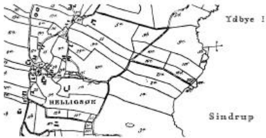
Fig. 1. Kort over matrikler og veje 1815. Den ældste skole er de to bygninger på matr. nr. 2 b. I 1816 bygges en ny skole lige under 2-tallet på matr. nr. 2 a. I skellet mellem 1 a og 2 a anlægges en vej, og hvor denne rammer Gundtofte Å, der danner skel mod Sindrup, bygges skolebroen. I 1885 bygges en ny skole lidt øst for kirkegården syd for vejen fra Helligsø by. Er ikke vist kortet.

På kortet fig. 1 fra 1815 ses den ældste skoles beliggenhed på matr. nr. 2 b lige nord for vejen, den nuværende Vestervej, der går fra Helligsø by ind i præstegården. Det er sandsynligt, at skolen har ligget her lige så længe, der har været givet undervisning.