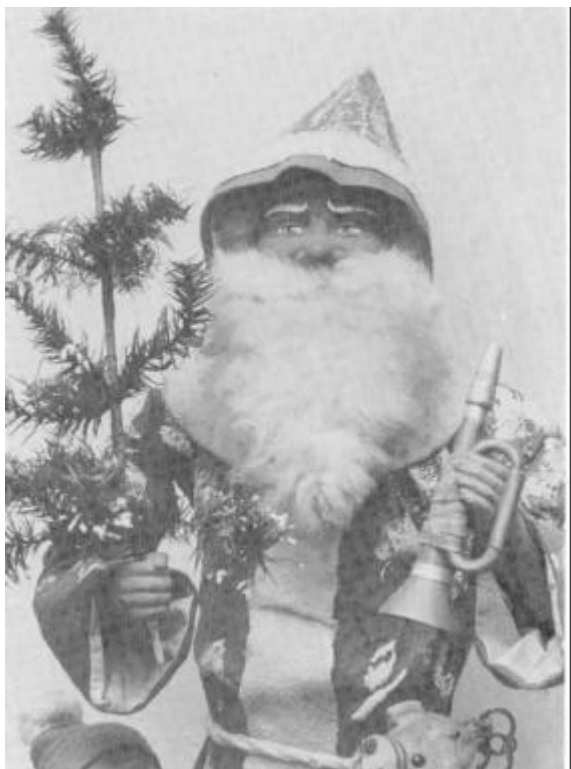
Nissen fra Nors

Thisted Brandvæsens gamle hestetrukne brandsprøjte har, siden den i 1923 blev taget ud af brug, ført en omflakkende tilværelse, og til sidst var den på Fyn. Den er nu, takket være en donation fra Sparekassen Thy, erhvervet til museet i Thisted og blev i forbindelse med jubilæumsudstillingen vist frem på Thisted Brandstation i november 1982 i velrenoveret stand.