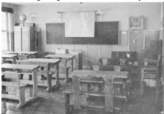
Lindhalsminde gamle skole.