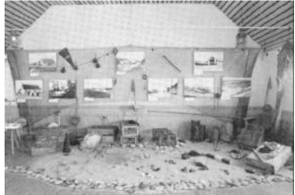
Den lokalhistoriske udstilling fyldte den ene ende af Lildstrand Forsamlingshus med minder over de hundrede år, man festede så smukt for. Udstillingen bragte en stemning af hav med inden døre, dertil kom den til at virke som et minde over de mennesker, som tog deres tørn ved den kyst, der skulle blive hjemsted for et stadig livskraftigt fiskerleje.

Fiskerlejet Lildstrand dannedes for hundrede år siden,