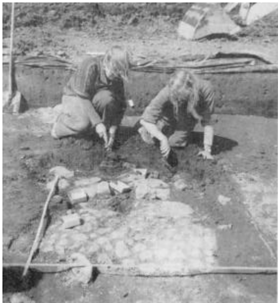
Fig. 3: Stenbrolagt vindfang til jernalderhus under afdækning ved Heltborg.

Som en nyhed viste udgravningen imidlertid også, at der på stedet allerede i slutningen af bronzealderen havde ligget huse, idet der i undergrunden blev fundet en række stolpehuller tilhørende et ca. 18 meter langt og 6 meter bredt hus af en helt anden konstruktion end de traditionelle jernalderhuse med deres tørvebyggede vægge. Bronzealderhuset, der er det først undersøgte i Thy, havde nemlig stolpesatte vægge og ligner helt tilsvarende huse udgravet i Vestjylland. På et tidspunkt blev bronzealderbebyggelsen nedlagt, stedet udlagt som marker, for først et par århundreder senere igen at blive inddraget til bebyggelse.