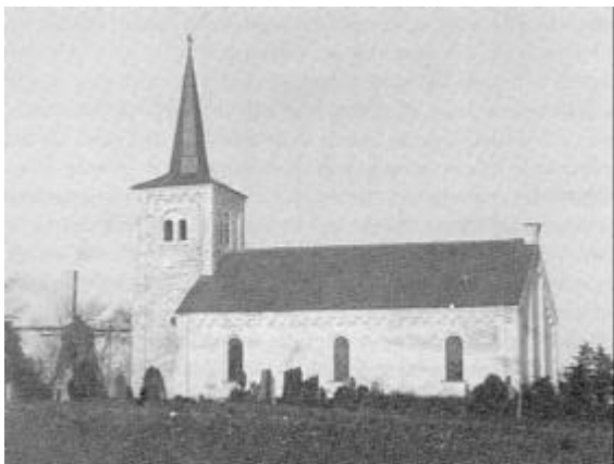
Klim Frimenighedskirke fotograferet i 1930'erne

Bestyrelsen har altså ønsket at spare medlemmerne for den økonomiske byrde, det kunne være at vælge den dyre løsning. Men ved menighedsmødet vil man ikke spare og nøjes med et spir, man vil have både tårn og spir, som det fremgår af det følgende: