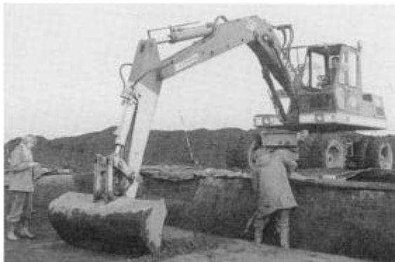
Bopladsudgravning ved Heltborg. Nedgravningen igennem de tykke boplads lag foregår med maskinkraft, indtil huse eller andre anlæg dukker op, hvorefter den videre afdækning sker med skovl og graveske.

I århundrederne omkring Kristi fødsel har der på stedet ligget en mindre landsby, hvis tilstedeværelse i dag giver sig tilkende som et op til 1,5 m tykt muldlag med husrester, brolægninger og forskellige affaldslag med mængder af lerkarskår. Boplads af denne type er meget karakteristiske for Thy. På grund af de tykke boplads lag fremtræder de i terrænet som mindre forhøjninger og kaldes derfor byhøje.