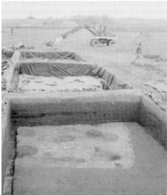
Bopladsudgravning ved Heltborg. Beboelseshus med lergulv dækket. I baggrunden det vidt fremskredne vejbyggeri til omfartsvejen nord om Hurup.

I forbindelse med anlæggelsen af en omfartsvej nord om Hurup foretager museet en større undersøgelse af en boplads fra ældre jernalder ved Heltborg. Undersøgelsen blev påbegyndt i efteråret 1981 og forventes afsluttet omkring 1. oktober 1982.