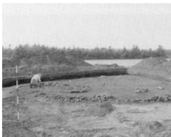
Udgravning af overpløjet høj ved Førby. Den sydøstlige fjerdedel af højen med forskellige stensatte grave afdækket.

Som de fleste storhøje fra bronzealderen var denne bygget i flere omgange. Den første høj viste sig kun at have målt ca. 6 m i diameter. Den var anlagt over en lille stenkiste med brændte knogler af et formodentlig 5-6 års barn. I graven fandtes desuden tøjrester og en pynteknap af bronze. Graven er antagelig et par hundrede år ældre end stenkisten med sværdet.