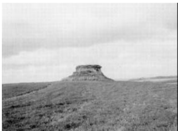
Gravhøj ved Villerup før udgravning.

Sidste år omtales undersøgelsen af en overpløjet høj ved Toftum i Sydthy. Undersøgelsen blev foretaget som et