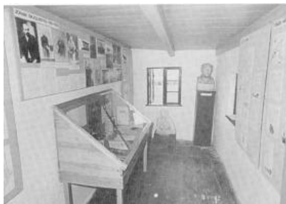
Et kig ind i Johan Skjoldborgs mindestue i barndomshjemmet i Øsløs

Efter at genstandene var konserverede og huset gennemgribende istandsat, fandt der i foråret en nyopstilling sted, som åbnedes for publikum den 20. juni. Ved nyopstillingen er det forsøgt at følge den beskrivelse af huset og dets brug, som Johan Skjoldborg har givet i erindringsværket "Min Mindebog". Et af rummene er inddraget til uddybende forklaring om forfatterskabet og om Hannæs på den tid, digteren levede der. Der henvises i øvrigt til artiklen andetsteds i årbogen.