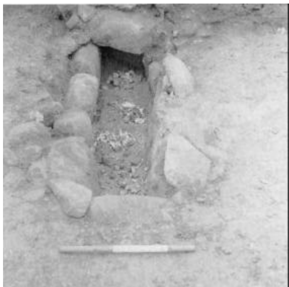
Den store stenkiste i Villerup-højen efter åbningen.

kommunalt beskæftigelsesprojekt i samarbejde med museet. Samme projektgruppe påbegyndte i efteråret 1981 undersøgelsen af en stærkt medtaget høj ved Villerup i nærheden af Bedsted. Undersøgelsen måtte indstilles på grund af den tidlige vinter, men blev fuldført i foråret 1982, denne gang finansieret af Fredningsstyrelsen.