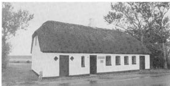
Johan Skjoldborgs Barndomshjem i Øsløs.

I efteråret 1981 hjemtog museet alle de genstande, der tidligere var udstillet i digteren Johan Skjoldborgs barndomshjem i Skippergade, Øsløs, for at lade dem gennemgå en meget påkrævet konservering.