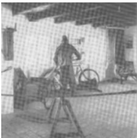
Detajle fra udstillingen på Fyrmuseet i Hanstholm.

I september måned overførtes derfor hele samlingen til museet i Thisted, hvor den har gennemgået en nøje registrering og en omfattende konservering. Disse arbejder er nu så vidt tilendebragt, at en betydelig del af samlingens bedste stykker har kunnet integreres i nyopstillingen af en del af udstillingen i museumsbygningerne ved Hanstholm fyr, idet et særligt afsnit i denne udstilling er viet tidligere tiders småsamfund omkring kystfiskeriet ved den thylandske kyst.