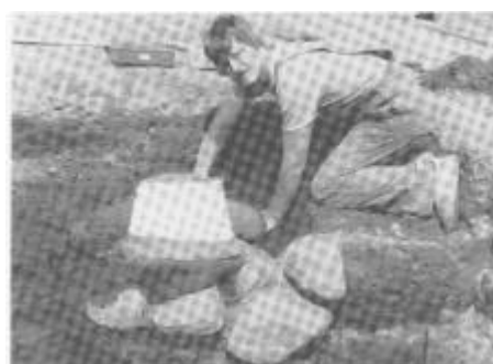
Afdækning af urne, indsat i siden på gravhøj ved Heltborg. Den øverste del af urnen er omviklet med gaze for at beskytte den mod yderligere beskadigelse.

Med økonomisk bistand fra Viborg amtskommune har Thisted kommune og Thisted museum startet er