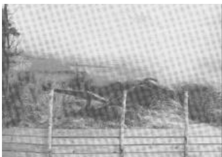
Panorama fra Fyrmuseet i Hanstholm.

Havnebyggeriet har fået et særligt afsnit, ligesom der i