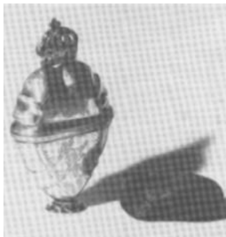
Hovedvandsæg af sølv. Højde 8 cm. Duftsvampen er velbevaret

Thisted Museum har i 1981 som gave fra private modtaget en række værdifulde genstande, hvoraf skal nævnes: et stort kokekar af ler fra midten af 1800-tallet, et dukkehus