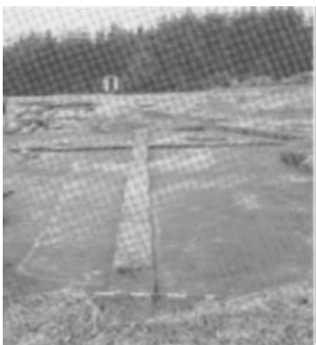
Hustomt fra ældre jernalder, afdækket ved Skårup.

Alle husene på bopladsen har den samme "klassiske" konstruktion, der er velkendt fra de store jernalderlandsbyer ved Ginnerup og Vestervig: Tørvevægge og to rækker tagbærende stolper. Endvidere har samtlige huse ved Skårup stengrebning i stalden, der almindeligvis blev indrettet i husets østlige ende.