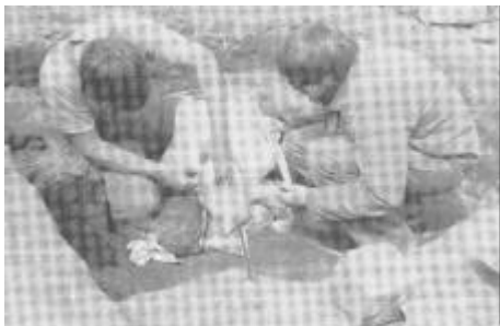
Optagning af samme urne som ses på foto nr. 2. Hele karret er nu omviklet med gaze og klar til at blive transporteret til museet i Thisted.