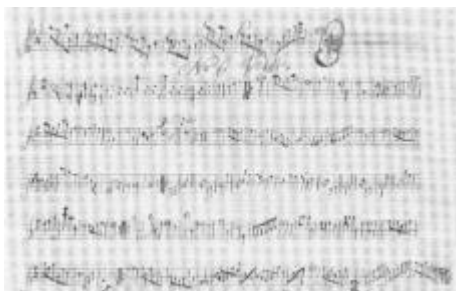
Valsen her findes som nr. 6 i de to nodebøger. Som det ses, er valsen udskrevet relativt tydeligt. Der kan spilles efter nodeskriften i modsætning til mange andre nodebøger fra tiden, som er nærmest ulæselige. Melodien er ganske køn, ret vanskelig at spille, men ret sangbar.