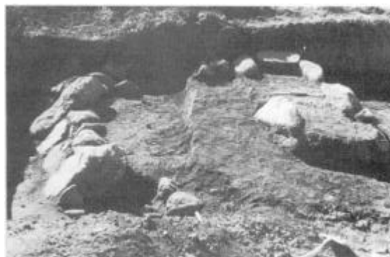
Høj fra ældre bronzealder under udgravning ved Tilsted. Billedet viser en del af randstenskæden omkring højen samt stenkisten i midten.