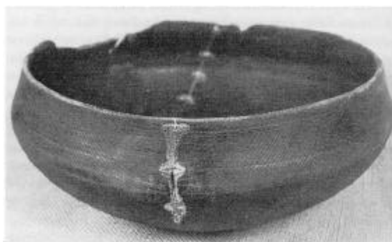
Træskål, fundet i Kollerup-koggens last.

I østfløjen er der indrettet en afdeling om vejlerne og reservatet, der bl.a. skal give baggrunden for deres opståen, og hvorfor netop de dyr og planter vokser der. I vestfløjen fortælles om områdets geologi og det gamle kystfiskeri. I hovedbygningen vises det gamle og det nye Hanstholm. Der fortælles om havnebyggeriet og om den nye by, der er opstået som følge af havnen. En anden vigtig begivenhed i Danmarks og ikke mindre i Hanstholms historie var den tyske besættelse fra 1940-45. Hele Hanstholms befolkning blev tvangsforflyttet og den tyske værnemagt anlagde et stort befæstningsanlæg, hvis spor stadig ses i og omkring Hanstholm.